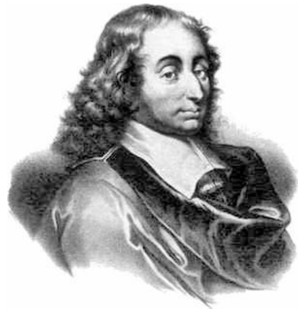
Блез Паскаль (19 июня 1623 — 19 августа 1662) — французский математик, механик, физик, литератор и философ