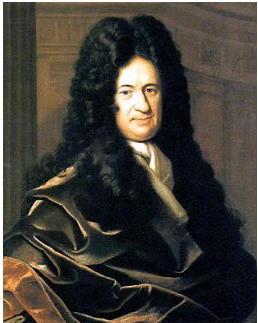
Готфрид Вильгельм Лейбниц (21 июня 1646–14 ноября 1716) — немецкий философ, математик, логик, физик, юрист, языковед, историк, дипломат