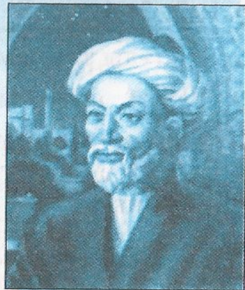
Мырза Ұлықбек (1394–1449)

Ондық бөлшектер және оларға амалдар қолдануды ұлы астроном және математик ғалым, мемлекет қайраткері Мұхаммед Тарағай Ұлықбек (1394–1449) ғылыми мектебінде ашқан. Бұл ғылыми мектептің жетекші ғалымдарының бірі Ғиясиддин Жамшид әл-Каши (1387–1430) 1427 жылы « Мифтоқ ул-хисоб » деп аталған атақты еңбегін жазады. Бұл кітап орта ғасыр математикасының энциклопедиясы, Шығыс мемлекеттері университеттерінде (медреселер) бір-неше ондаған жылдар математикадан негізгі оқулық болған. Бұл еңбек ғылымға жаңа ұғымды — «ондық бөлшек» ұғымын алып келді, оның ерекшеліктерін баяндады.