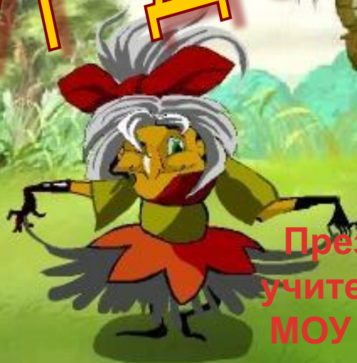
Таблица умножения и деления

Презентацию выполнила: учитель начальных классов МОУ Кантемировской СОШ №2