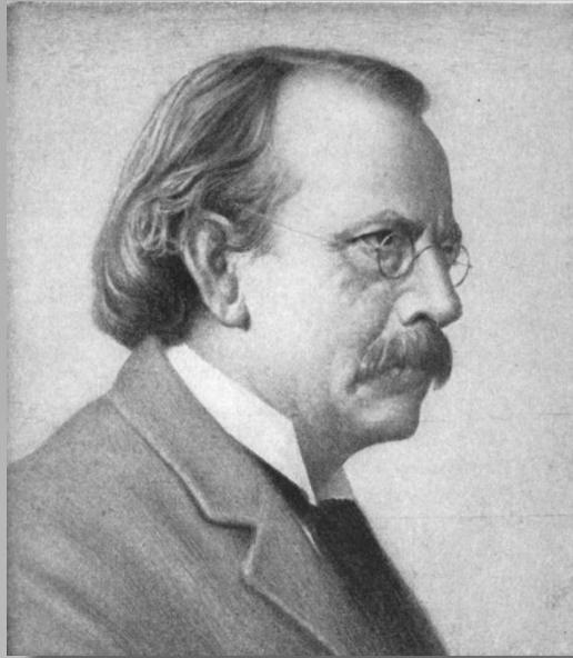
Томсон, Уильям (лорд Кельвин) (1824 - 2907)

В 1853 г. вывел формулу для определения периода электромагнитных колебаний.