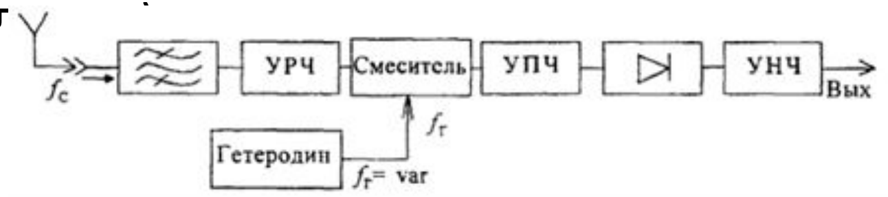
Рис.2 Супергетеродинный приёмник