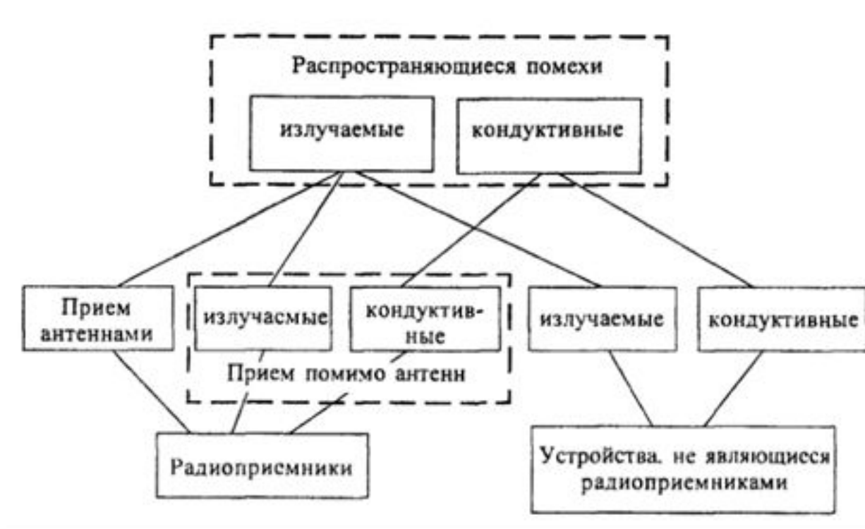
Рис. 1 Воздействие НЭМП на различные группы РЭС