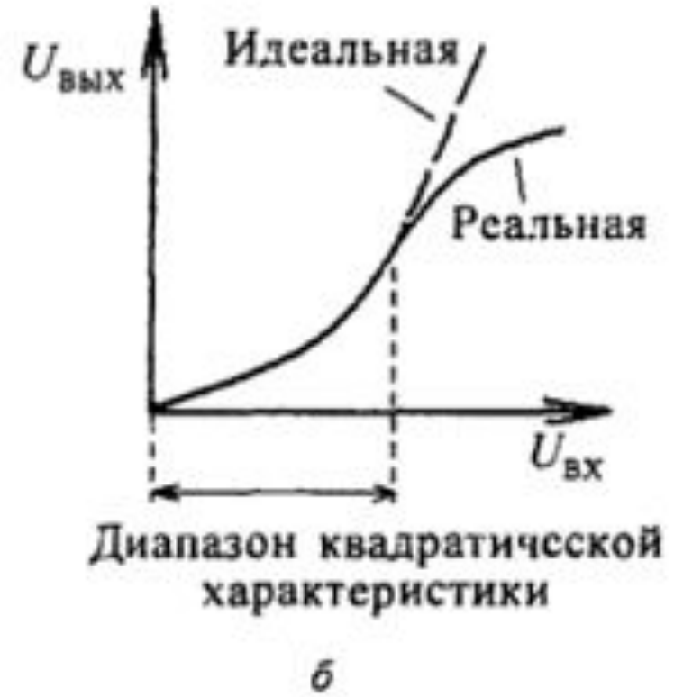
Рис. 4 Амплитудные характеристики: а - УРЧ, б – смеситель