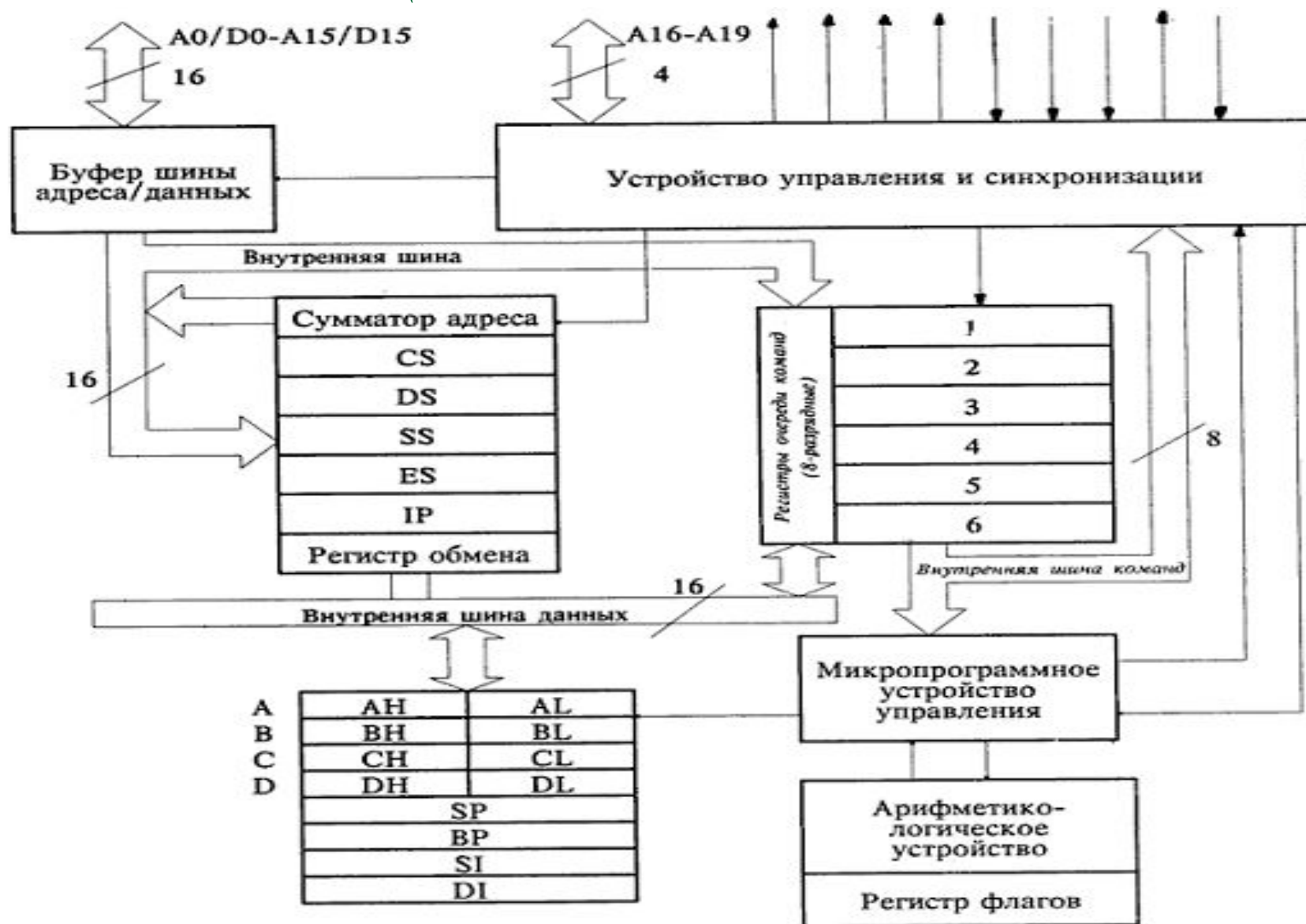
Рис.2. Внутренняя структура микропроцессора 8086.