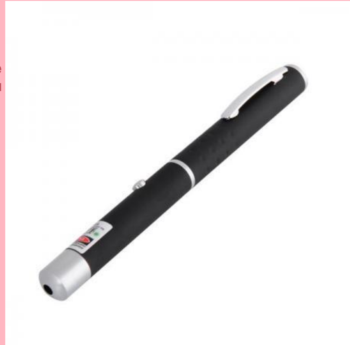
Green Laser Pointer 500 (590 руб.)