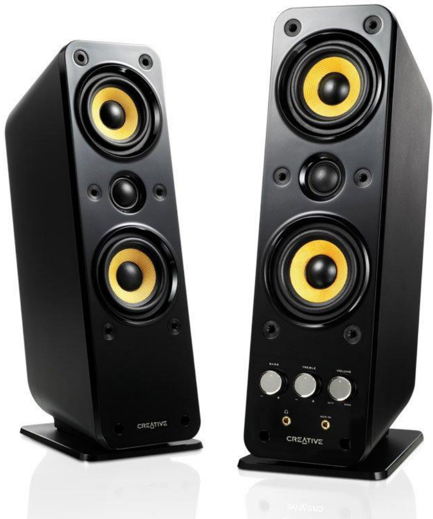
Creative GigaWorks T40 Series II (7331 руб.)

– устройство предназначенное для воспроизведения звука компьютером.