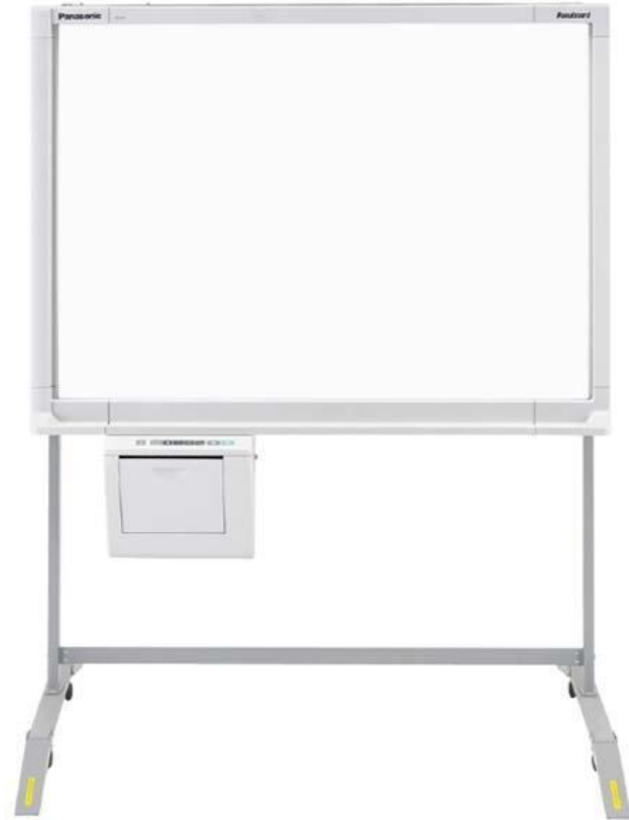
PANASONIC PANABOARD UB-5315G (21 320 руб.)

Копи-доска дает возможность делать записи маркером, как на стандартной белой доске. Если копи-доска имеет встроенный принтер, то можно сразу же распечатать написанные на доске записи. Копи-доски нацелены на рациональное использование времени. Определенные модели могут распечатывать, а также сохранять цветные изображения. Копи-доска, является экономичным вариантом на фоне интерактивной доски и проектора. Копи-доска может использоваться и как обычная маркерная доска и как копирующая.