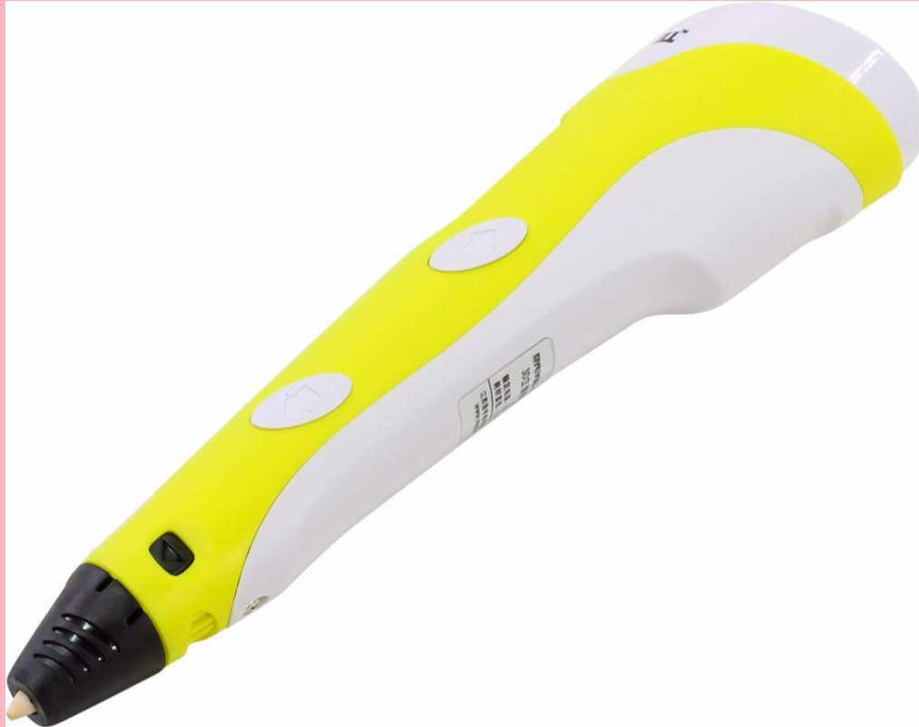
Myriwell RP-100B (2 950 руб..)