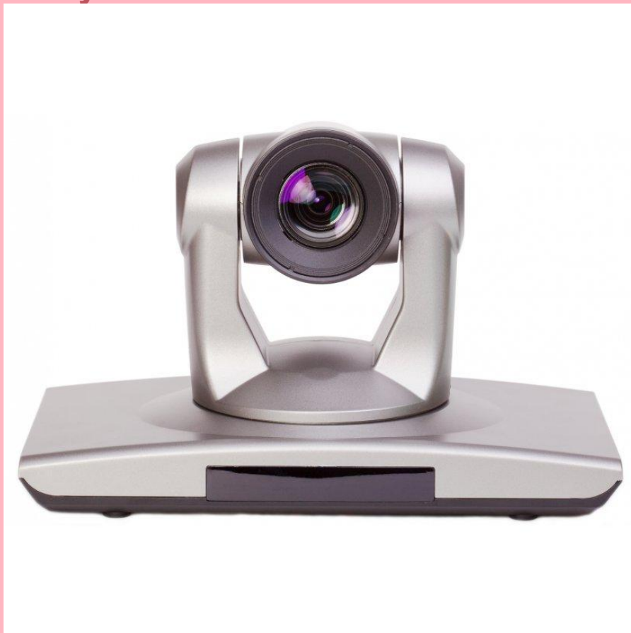
CleverMic Video Conference HD PTZ Camera (47 491 руб.)

- предназначена для использования в сеансах видеосвязи с удалёнными участниками.