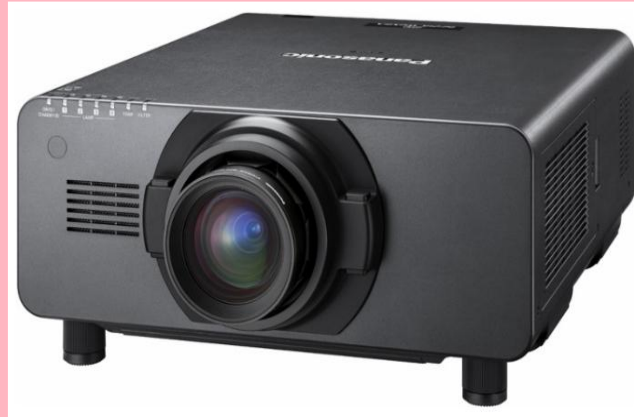
PANASONIC PT-DS20K(4 275 000 руб.)