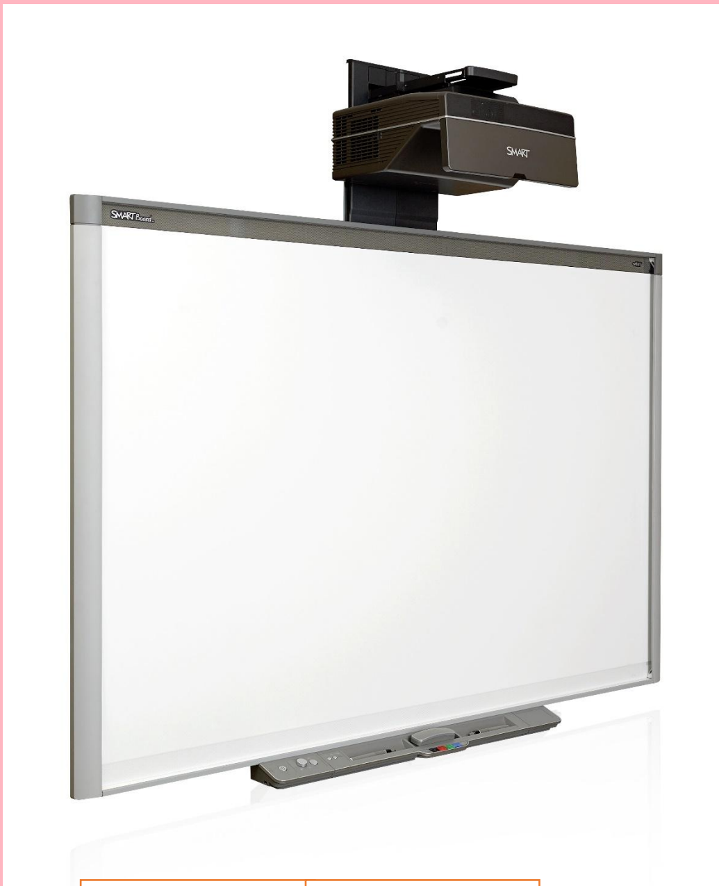
SMART SBX885 (199 900 руб.)