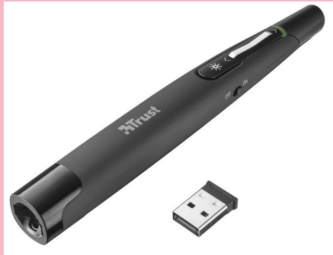
Trust Puntero Wireless Laser Presenter (1 750 руб.)