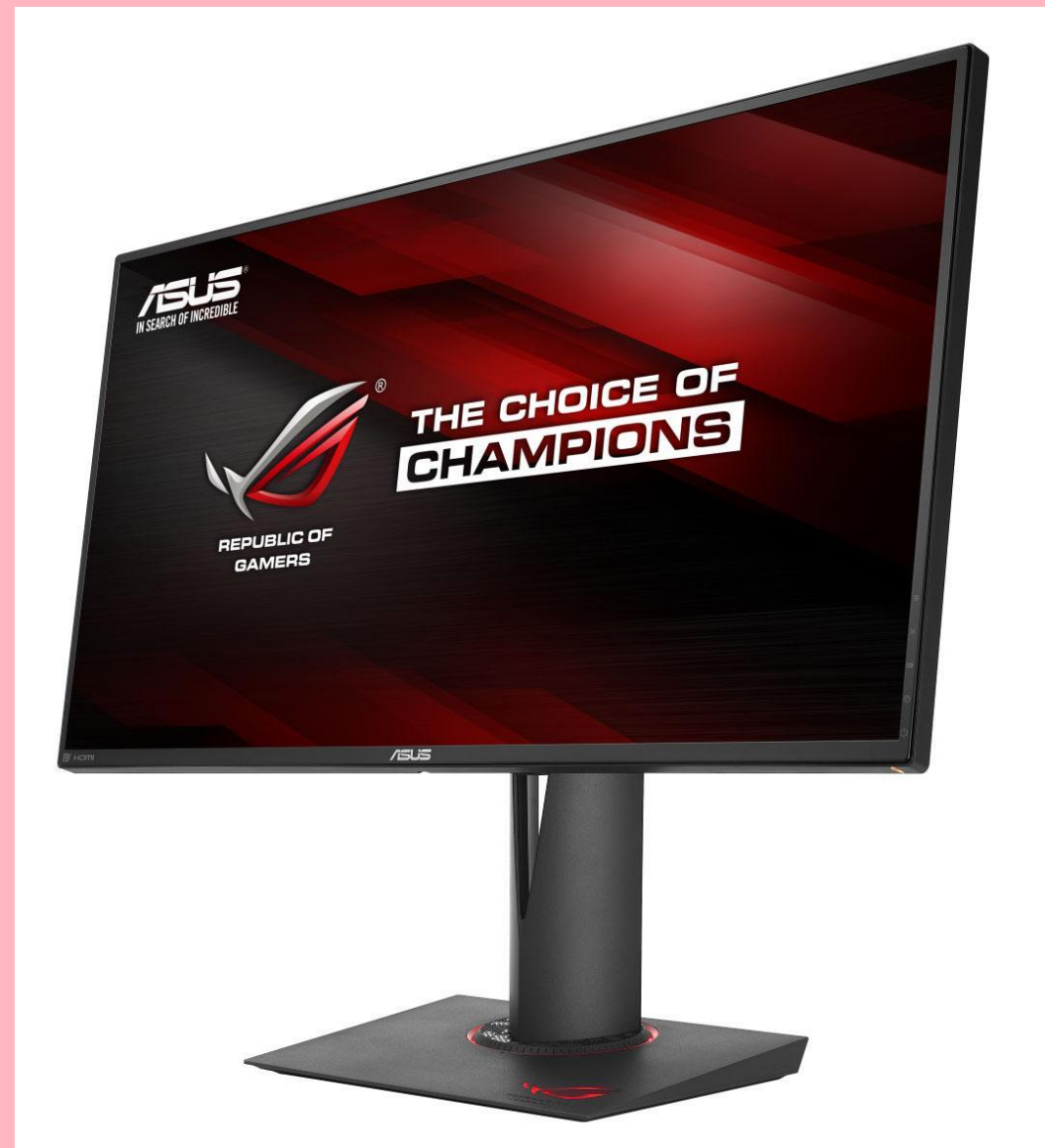
ASUS ROG Swift PG279Q (65 690 руб.)