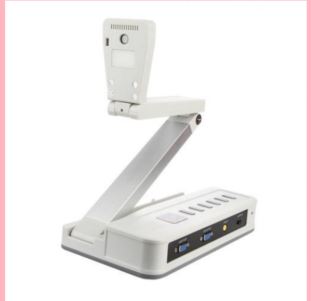
Classic Solution DC8h (17 070 руб.)