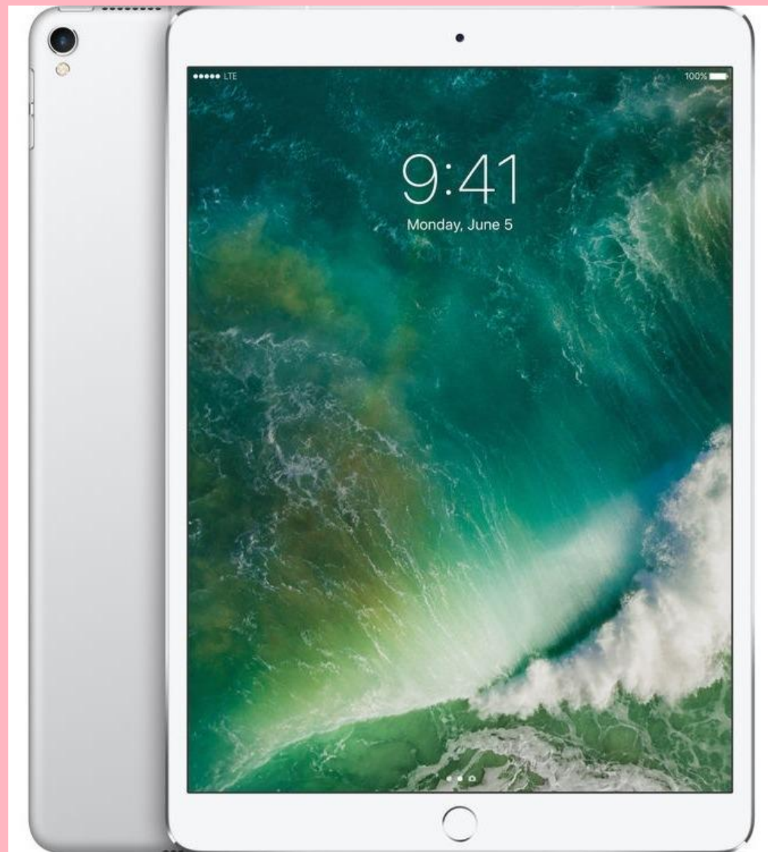
Apple iPad 39 990 (руб.)

— это устройство, обеспечивающее удаленную работу с ресурсами компьютера по беспроводной технологии. Интерактивные панели позволяют писать или рисовать прямо на экране, используя беспроводную ручку или мышь. Можно управлять презентацией или уроком, проецируя изображение на экран любых размеров, находясь в любой точке класса. Это позволяет использовать панели в различных помещениях, начиная с классов и заканчивая большими конференц-залами. К одному компьютеру может быть подключено несколько подобных планшетов, один из которых может использоваться в качестве планшета учителя.