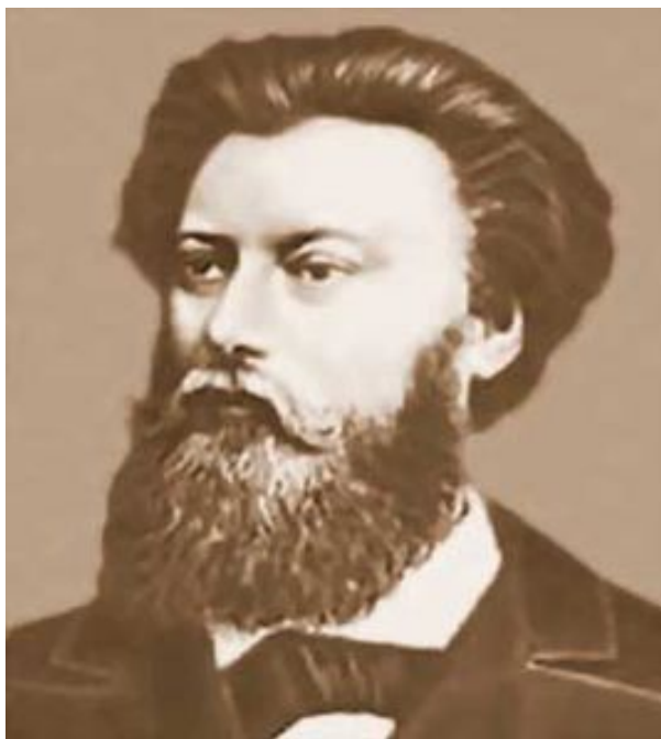
Павел Николаевич Яблочков