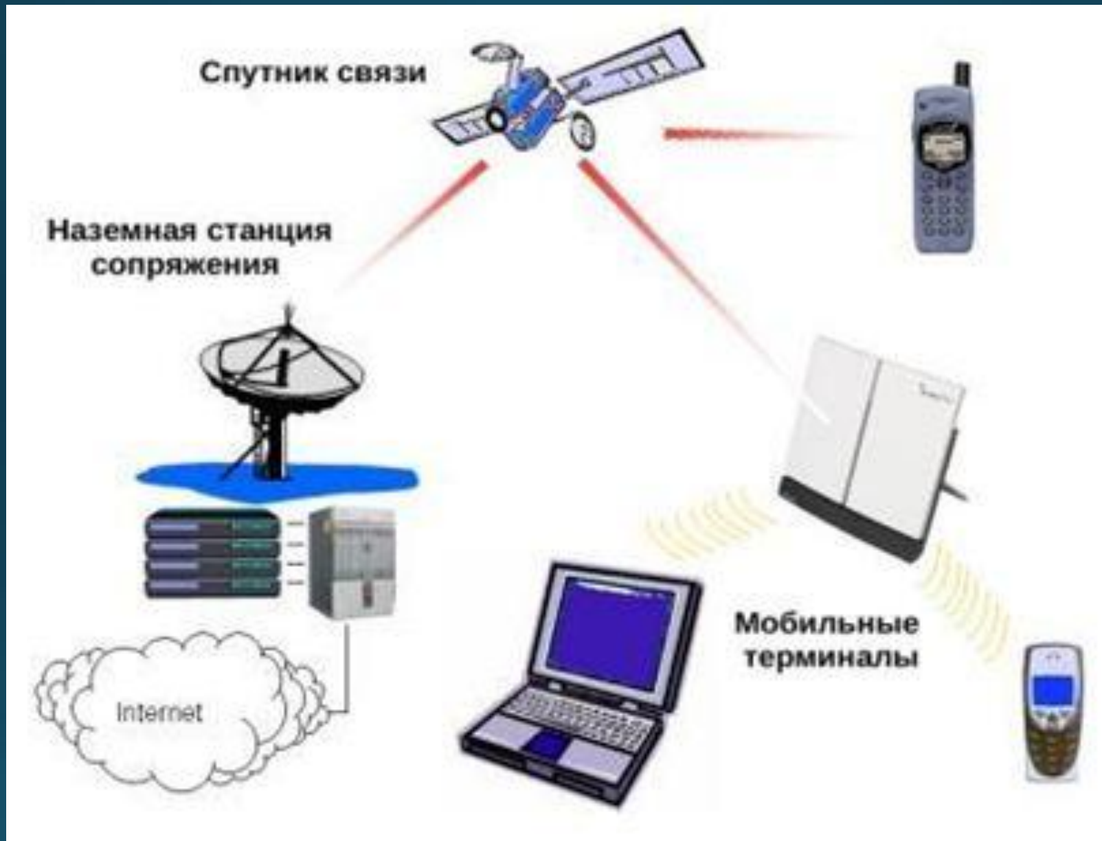
Типовая схема организации сети спутниковой мобильной связи