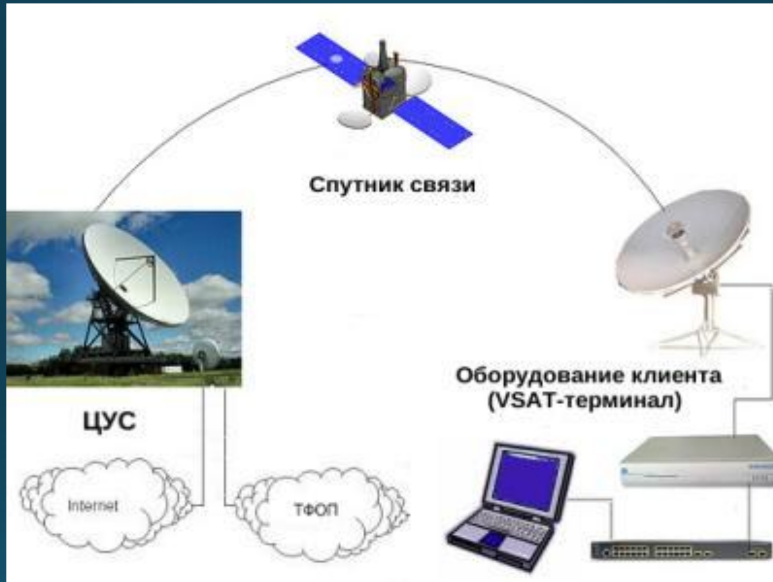
Схема организации спутниковой сети VSAT