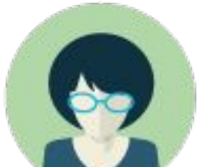
Абонент (владелец квартиры)