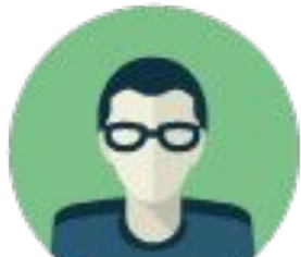
Абонент (пользователь/ квартиросъемщик)