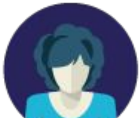
Абонент (потенциальный, без услуг МГТС)