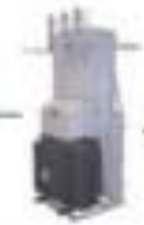
Понижающая трансформаторная станция (КТС)