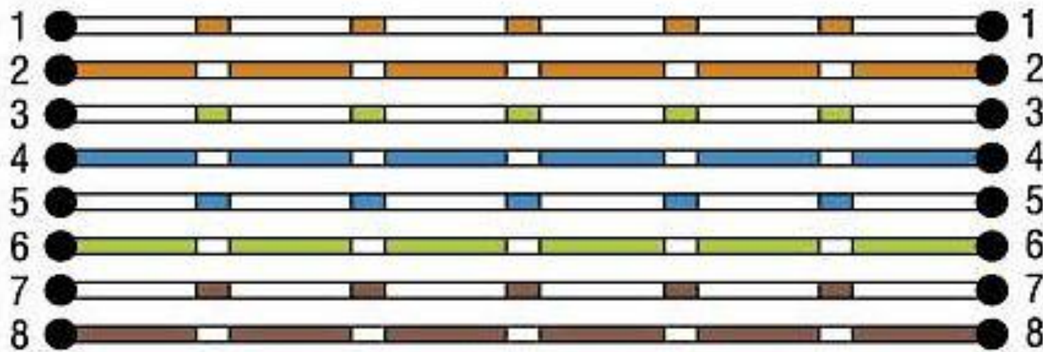
Соединение через свитч