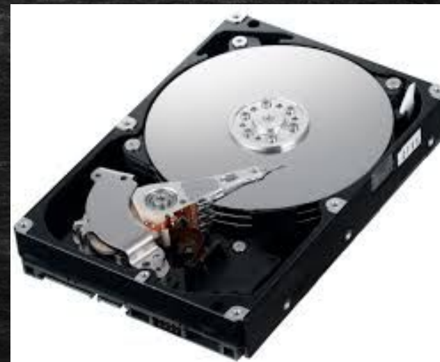
Қосымша қатқыл диск