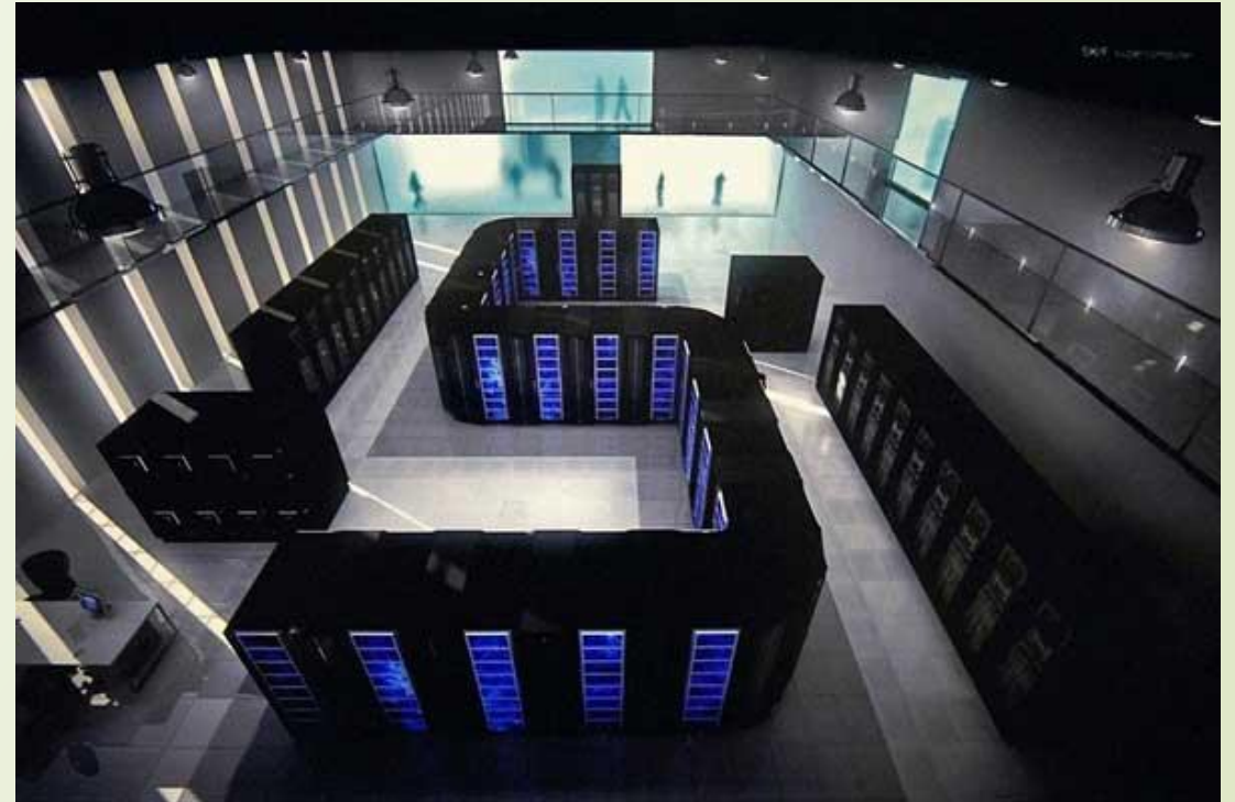
Супер-ЭВМ в Мюнхенском техническом университете. Супер-ЭВМ второго поколения, находящийся в ВНИИЭФ