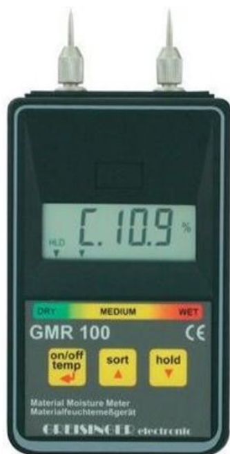
Влагомер, работающий на принципе кондуктометрического метода