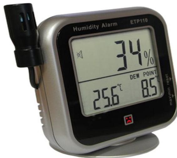
Прибор для измерения температуры и влажности воздуха с выносным датчиком.