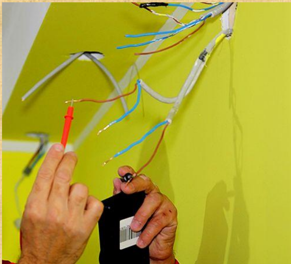
Проверка целостности проводника