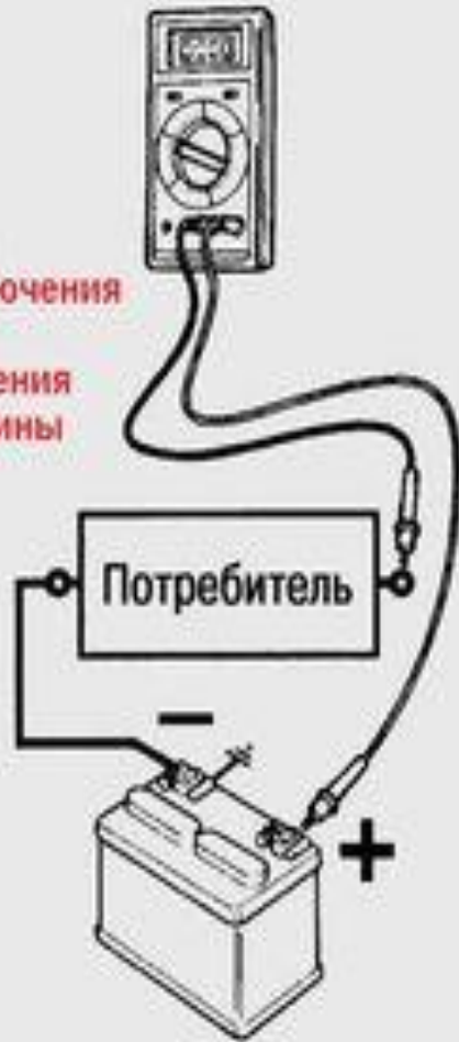
Схема подключения для измерения напряжения

Схема подключения для измерения величины тока