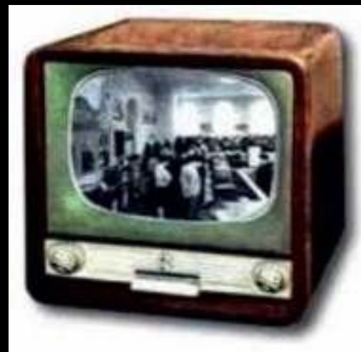
Цьому телевізору - 50 років