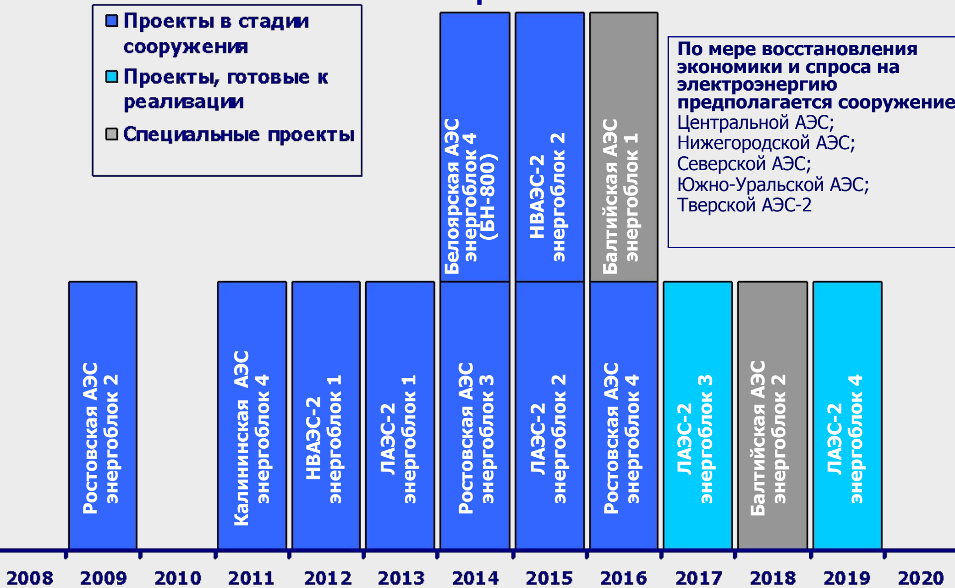
Рис.1.1 Энергоблоки АЭС, сооружаемые в настоящее время

2008 2009 2010 2011 2012 2013 2014 2015 2016 2017 2018 2019 2020