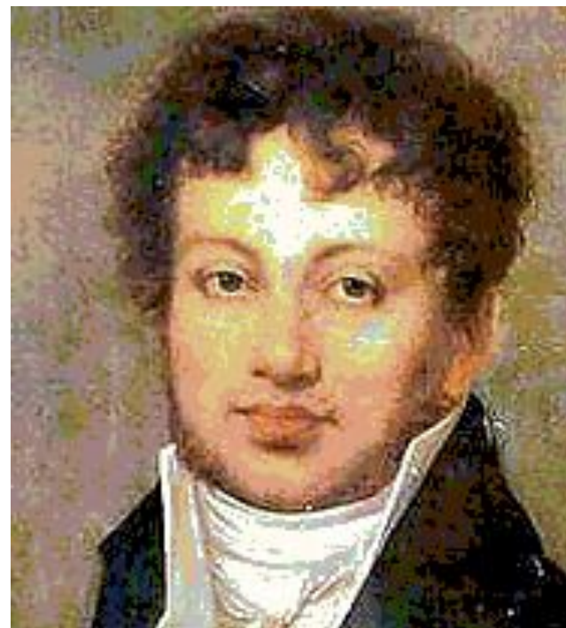
Ампер Андре Мари 1775 – 1836

французский физик, математик, химик, член Парижской АН (1814), иностранный член Петербургской АН (1830), один из основоположников электродинамики.