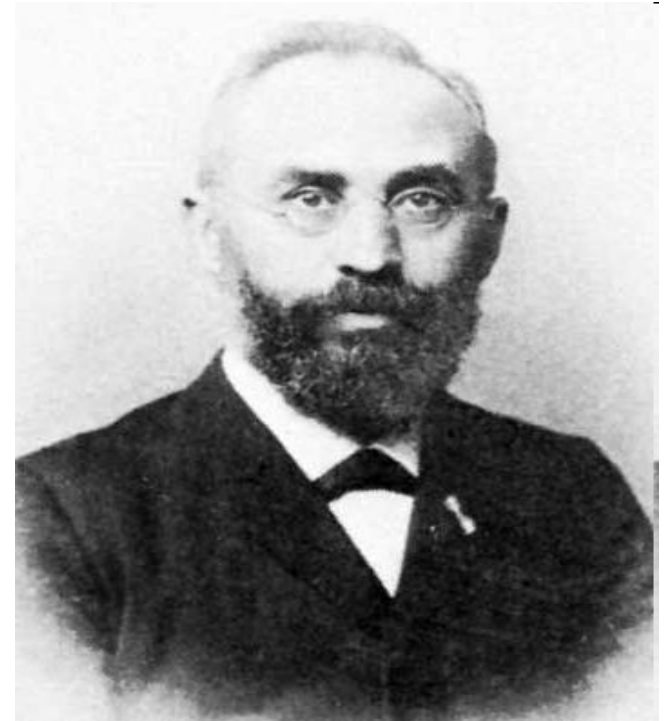
Лоренц Хендрик Антон

нидерландский физик – теоретик, создатель классической электронной теории