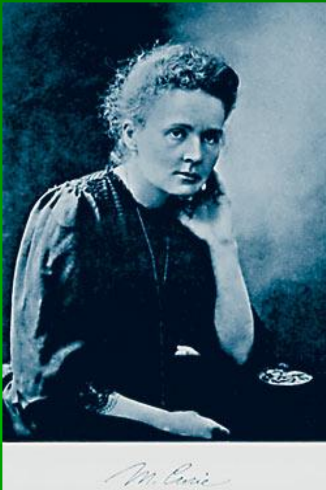
Мария Склодовская - Кюри (1867—1934)

Французский физик и химик , полька по происхождению, одна из основоположников учения о радиоактивности .