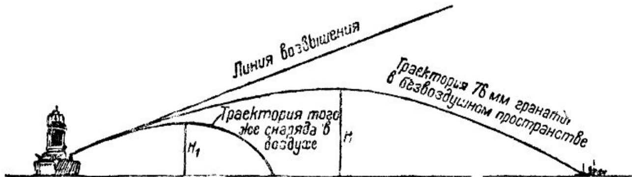
Рис. 1. Изменение траектории полёта снаряда от сопротивления воздуха