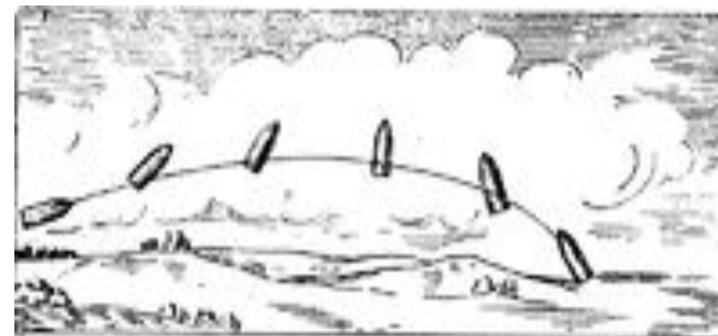
Рис. 3. Вращение снаряда в полёте под действием силы сопротивления воздуха