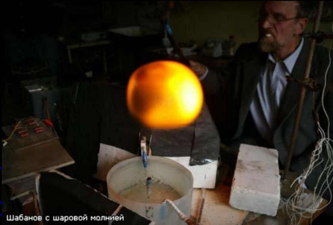
Шабанов с шаровой молнией