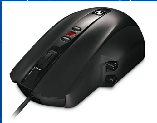
Microsoft SideWinder Laser