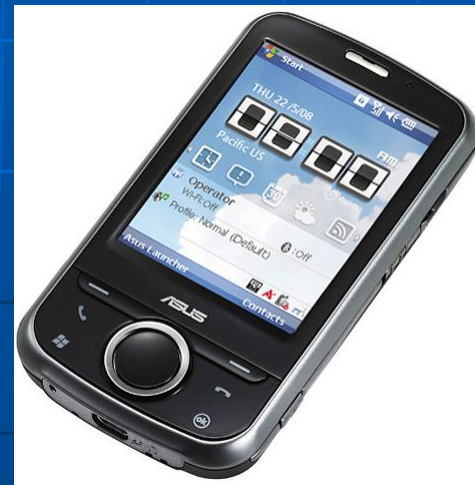
КПК Asus P320