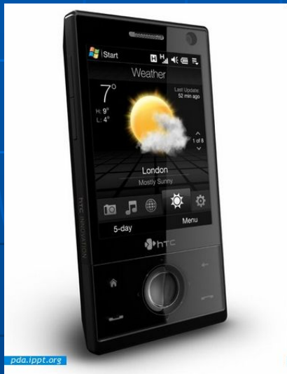
HTC Touch Diamond