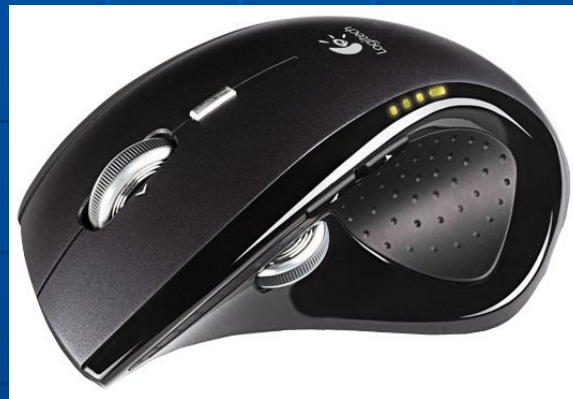
Logitech Cordless Laser MX Revolution