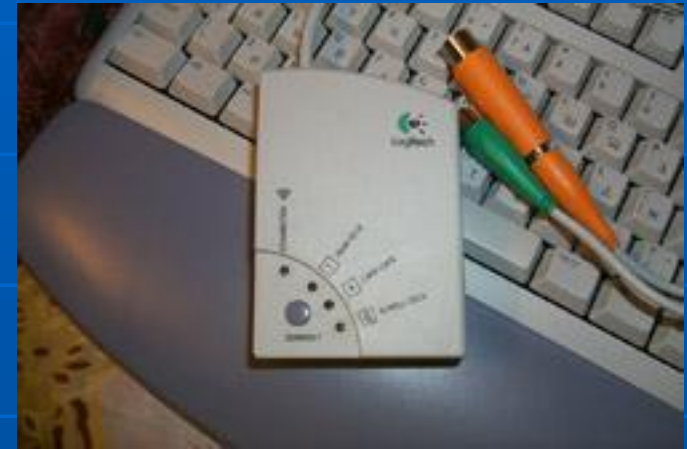
Беспроводная мышь и клавиатура фирмы Logitech