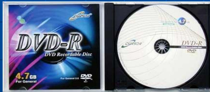
DVD-диск емкостью 4,7 Гб и лицевая сторон обложки