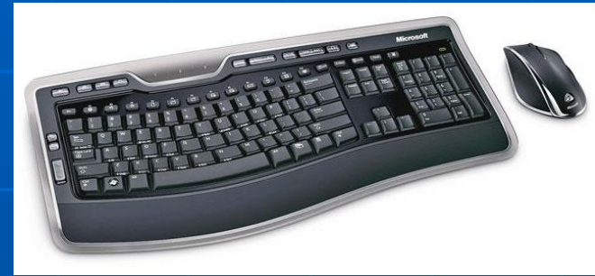
Образцы различного конструктивного исполнения клавиатур современных компьютеров

После нажатия клавиши клавиатура посылает процессору сигнал прерывания и заставляет процессор приостановить свою работу и переключиться на программу обработки прерывания клавиатуры. При этом клавиатура в своей собственной специальной памяти запоминает, какая клавиша была нажата (обычно в памяти клавиатуры может храниться до 20 кодов нажатых клавиш, если процессор не успевает ответить на прерывание). После передачи кода нажатой клавиши процессору эта информация из памяти клавиатуры исчезает.