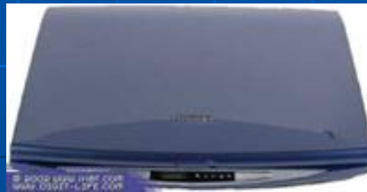
Ноутбук Toshiba Satellite 5105-s501