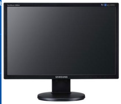
LCD монитор от фирмы Samsung