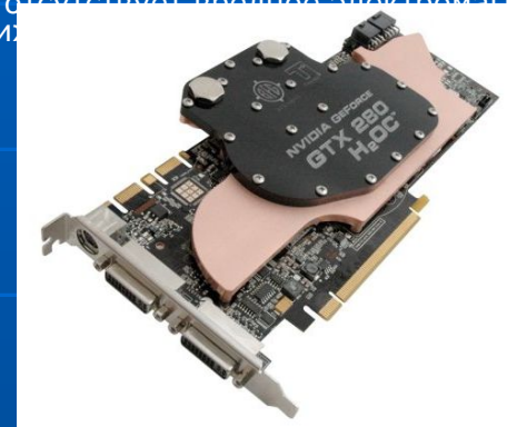
Видеокарта BFG GTX280 1Gb H2O

Один из показателей, характеризующих мониторы - размеры экрана. В настоящее время можно купить мониторы с размерами экрана от 15 до 21 дюйма по диагонали (1 дюйм=2,54см). Экран дисплея может работать в двух основных режимах: текстовом и графическом .