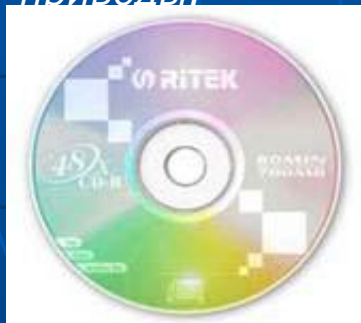
Оптический диск (CD) Емкость 80 мин/700 Мб (120 мм)