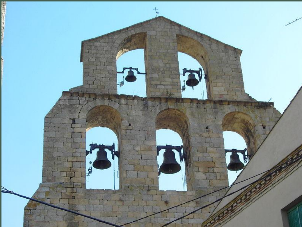
Espadaña de la iglesia de Santa María en Agullana.