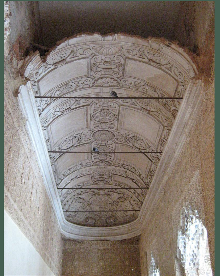
Bóveda de horno en el monasterio de San Pedro de Roda.