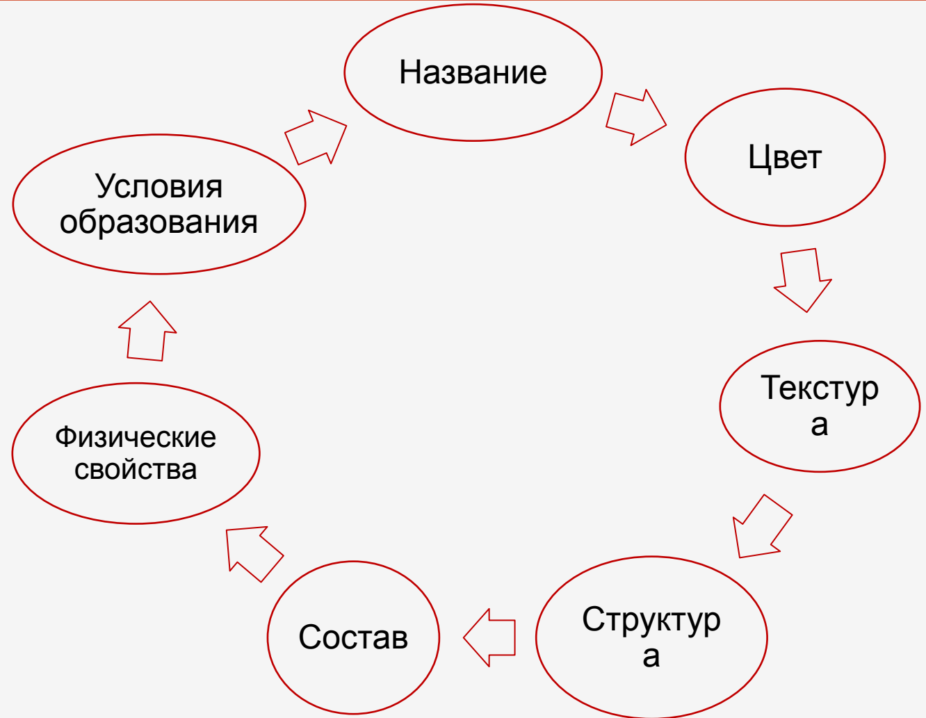
Рис.1 Содержание описания