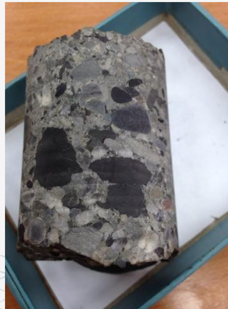
Рис.2 Состав обломки и цмента