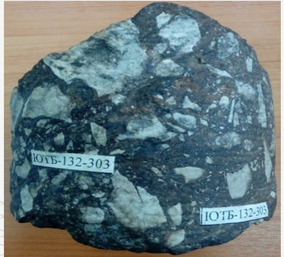
Рис.2 Состав обломки и цмента