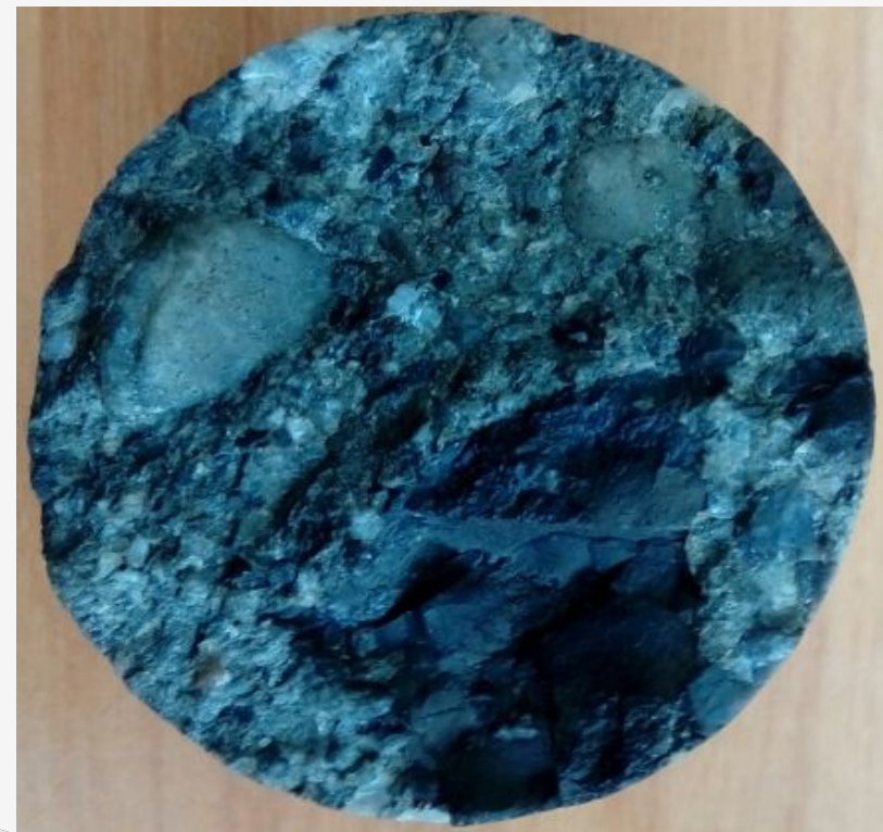
Рис.2 Состав обломки и цмента