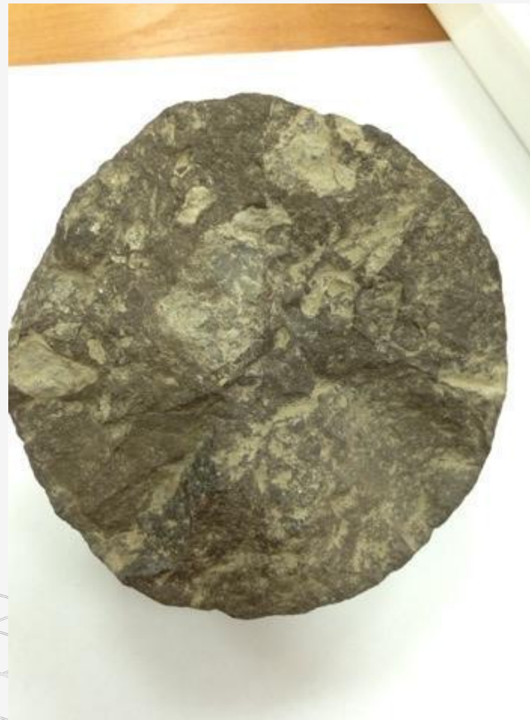
Рис.3 Водонасыщенный Характер породы