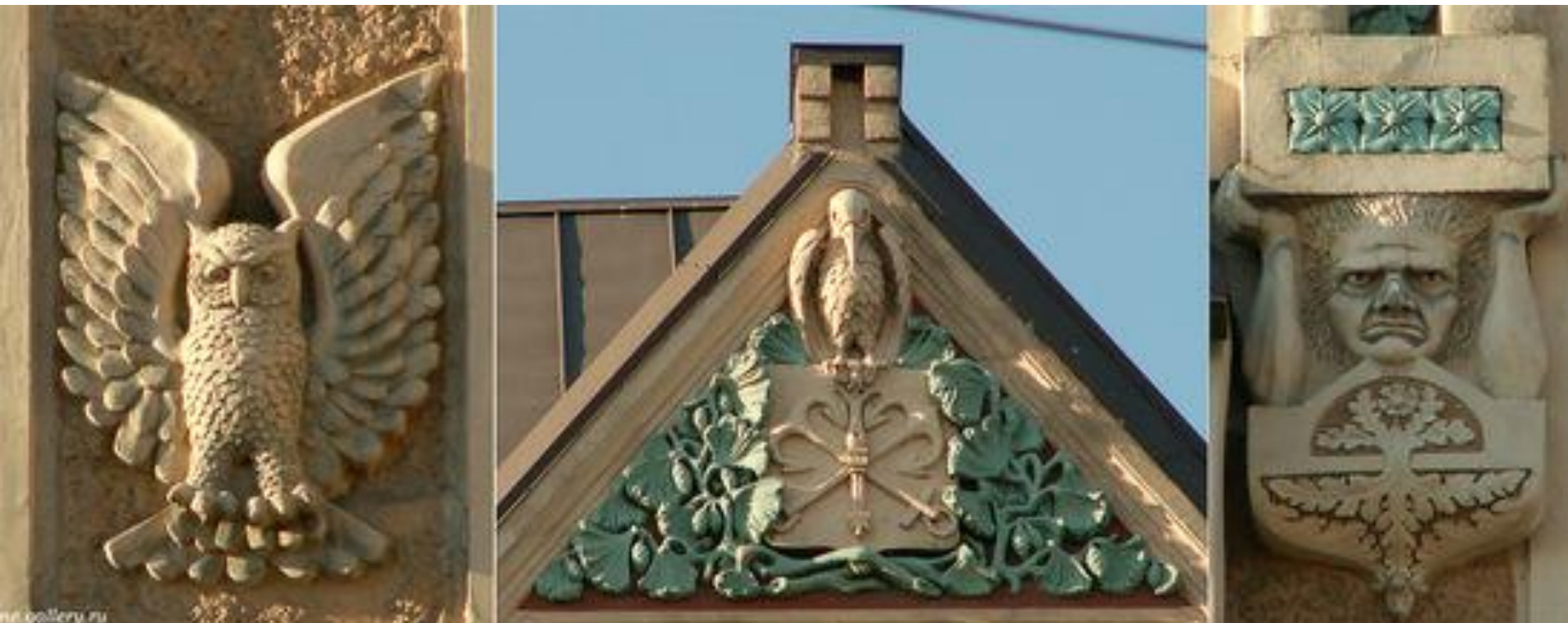
Дом на Владимирском проспекте.