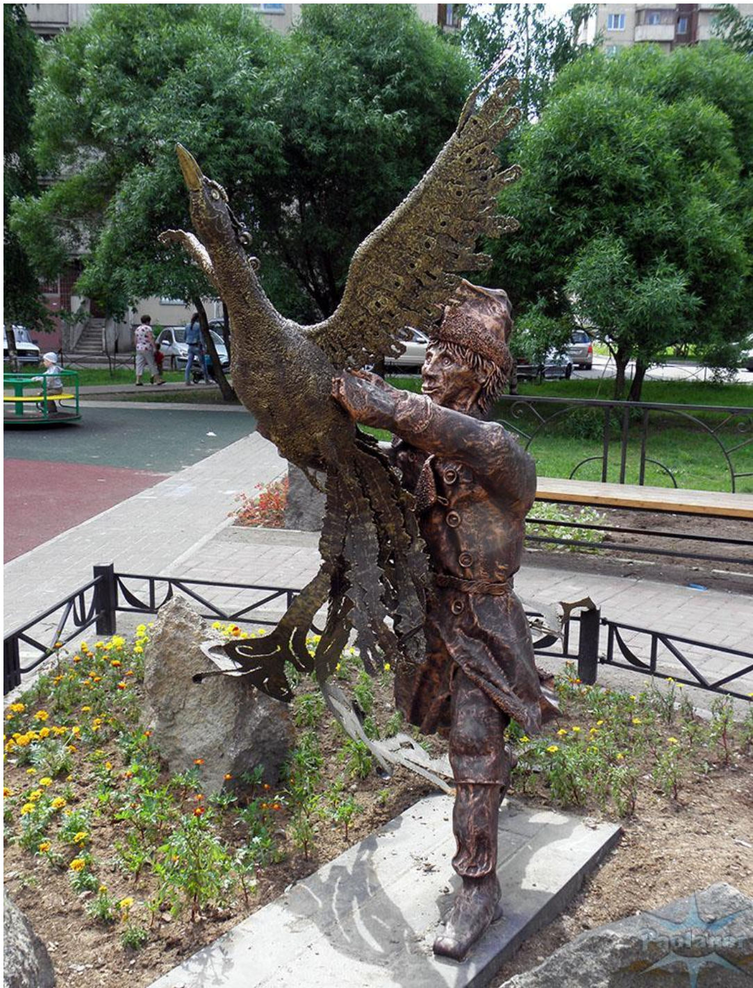
Афонская улица во дворе садика