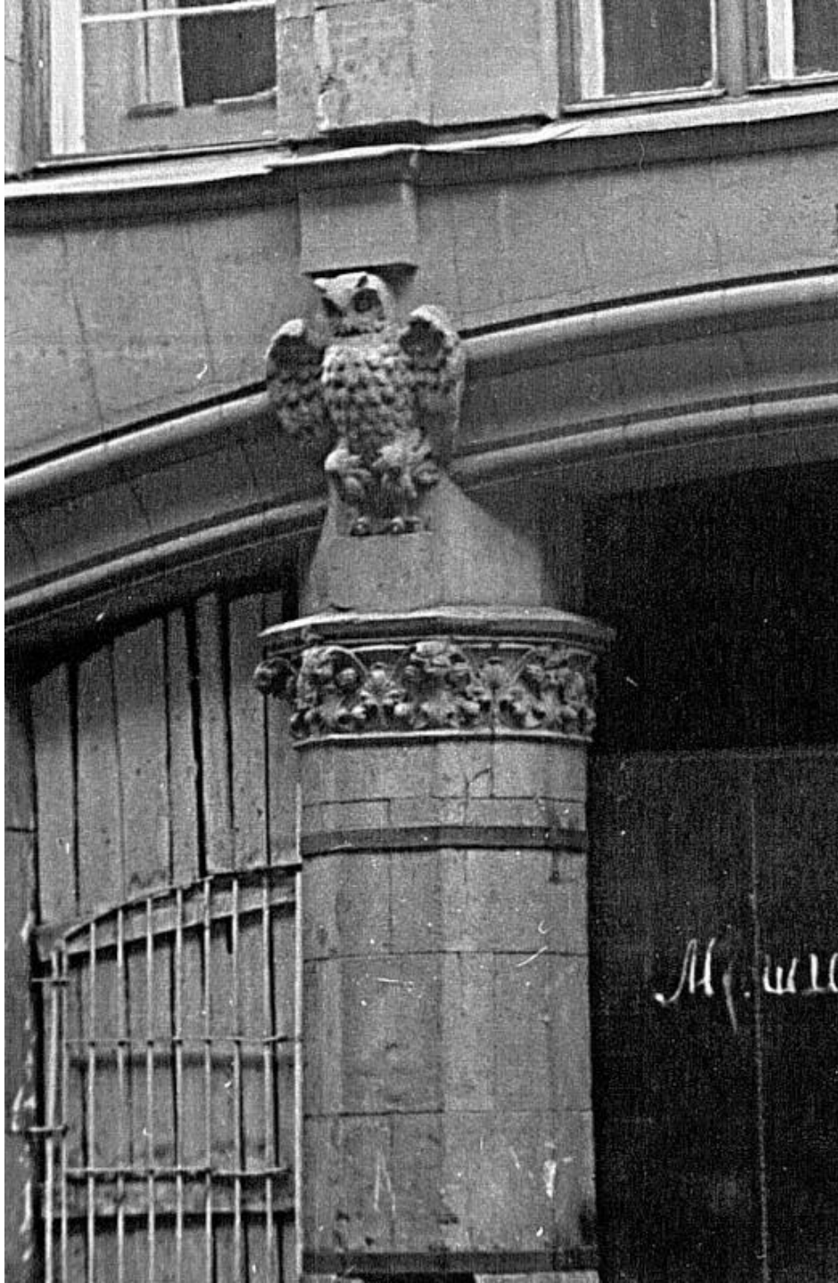
сова на фасаде дома 4 в Апраксином переулке