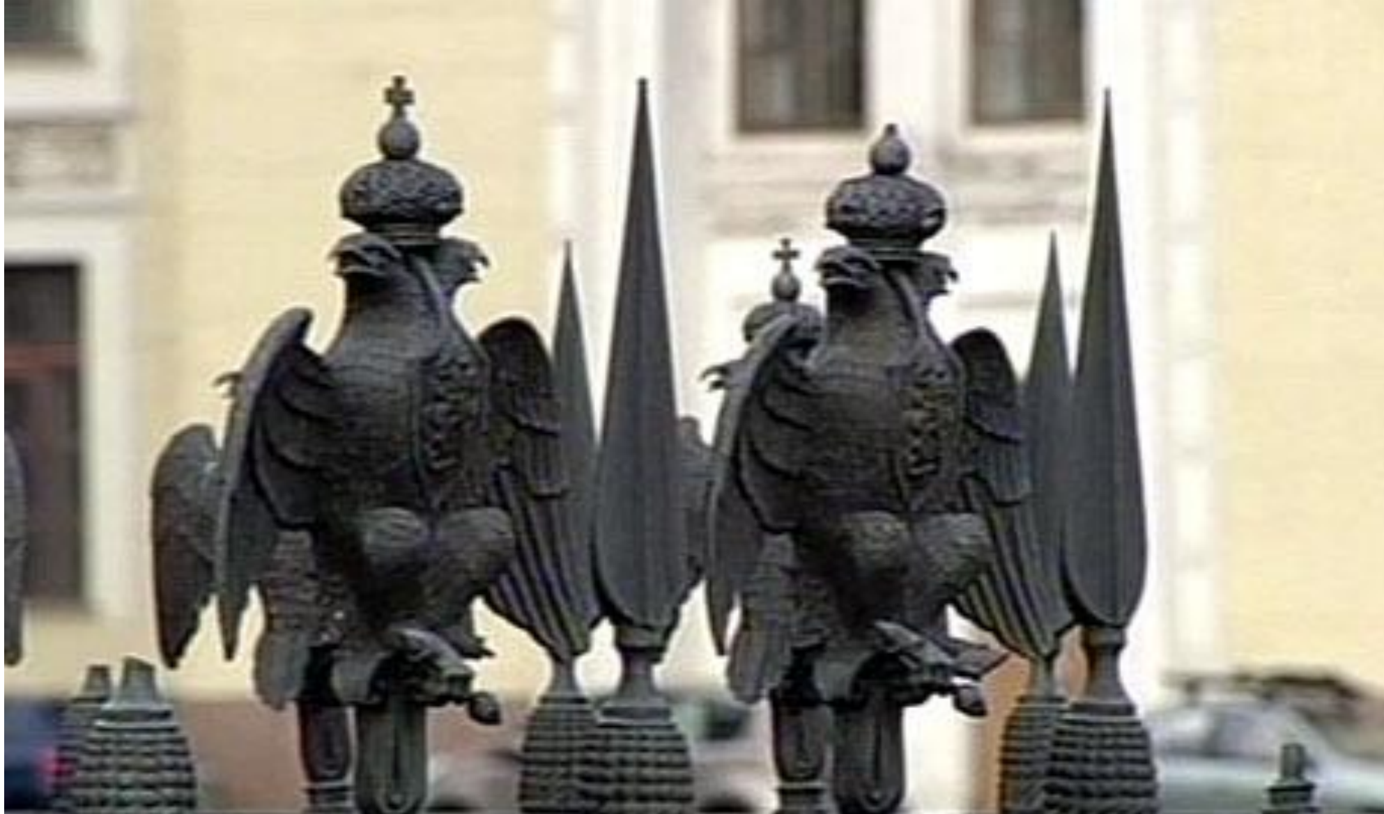
Ограждение Александровской колонны