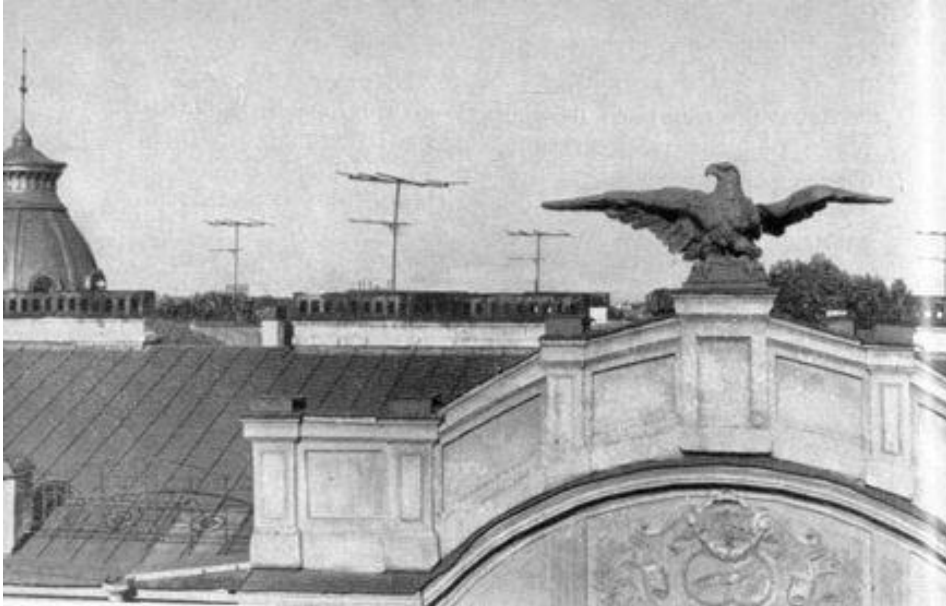
Орел на фронте дома 83 на Большом проспекте Петроградской стороны