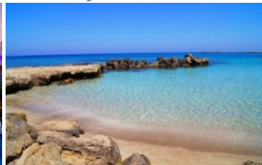
VIII конференция Кипр