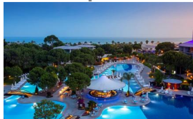
VII конференция Турция, Белек