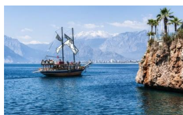
III конференция Турция, Анталия апрель 2013