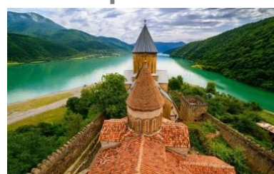
XIII Конференция Грузия, Тбилиси