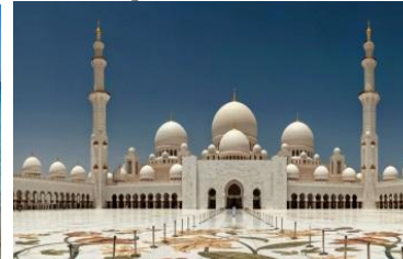
IX конференция ОАЭ, Абу-Даби апрель 2018