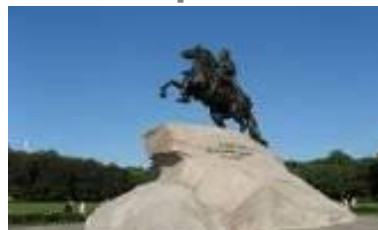
I конференция Санкт-Петербург май 2012