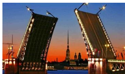
XI конференция Санкт - Петербург