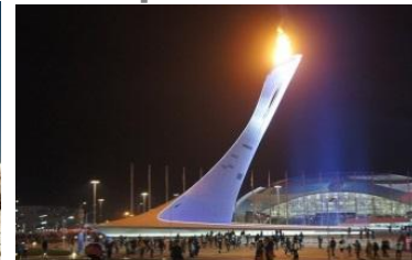
X конференция Сочи апрель 2019