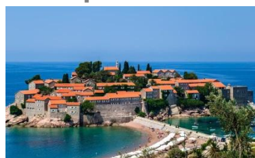
II конференция Черногория, Будва ноябрь 2012