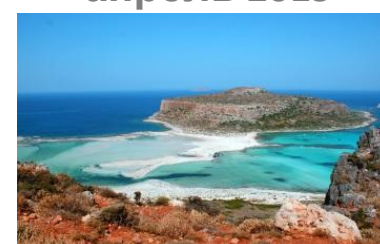
XIV конференция Греция, о. Крит