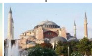
V конференция Турция, Стамбул апрель 2015