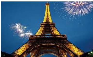
VI конференция Франция, Париж май 2016