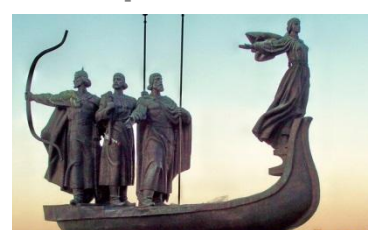
IV конференция Украина, Киев апрель 2014