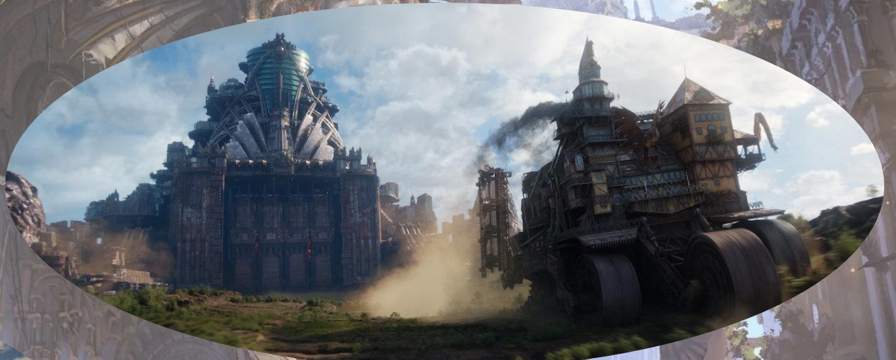
Кадры из фильма Кристиана Риверса “Хроники хищных городов”

Данный стиль не имеет широкого распространения в современной архитектуре.