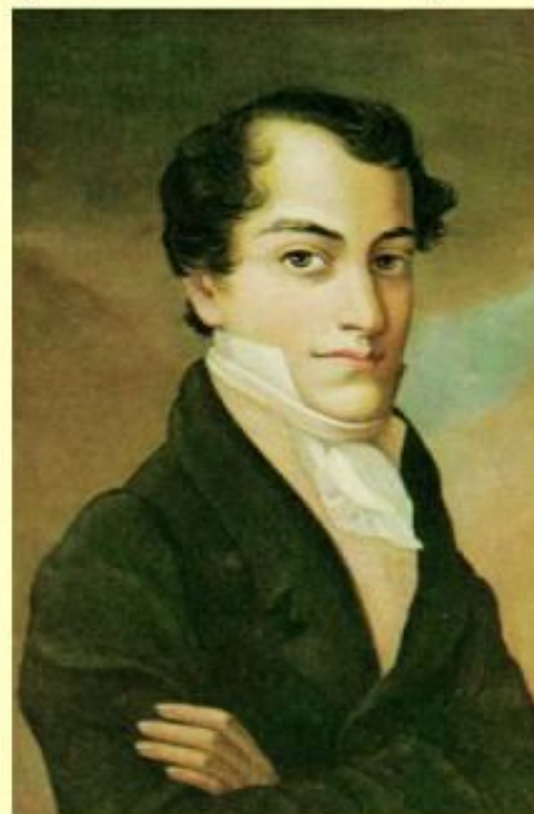
К. Ф. Рылов