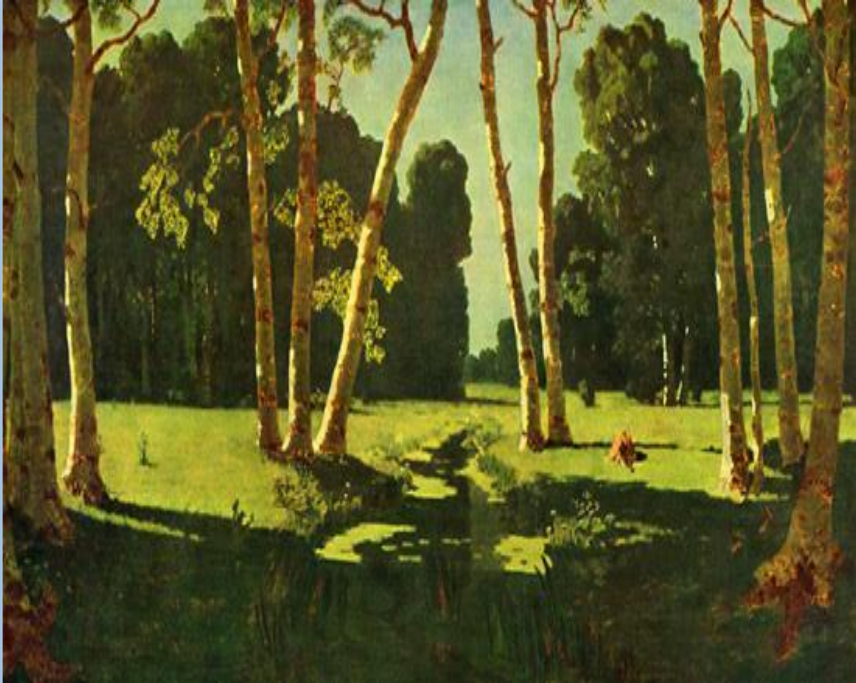
Куинджи А. И. Березовая роща