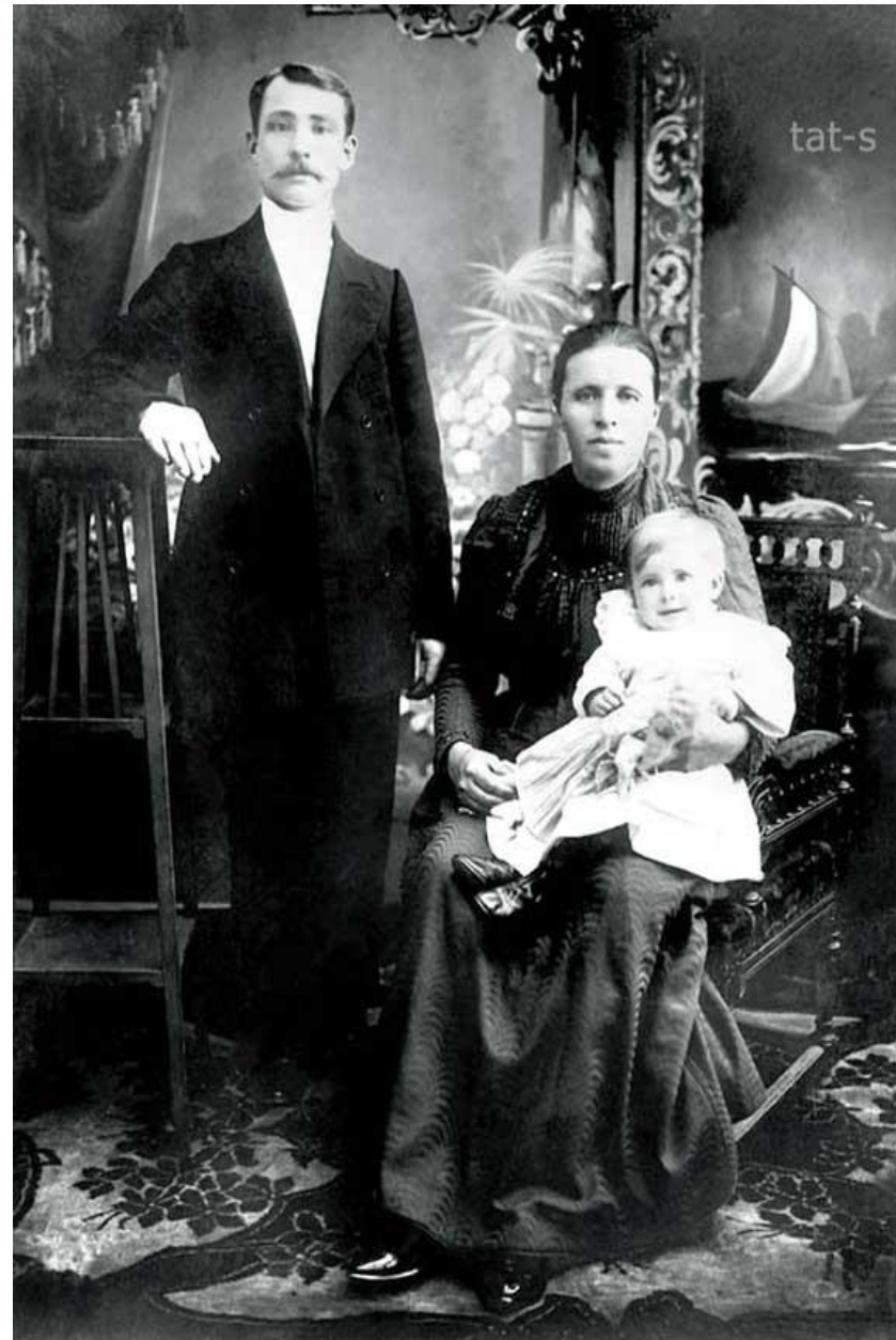
Родители Сергея Есенина. На коленях матери - дочь Александра.