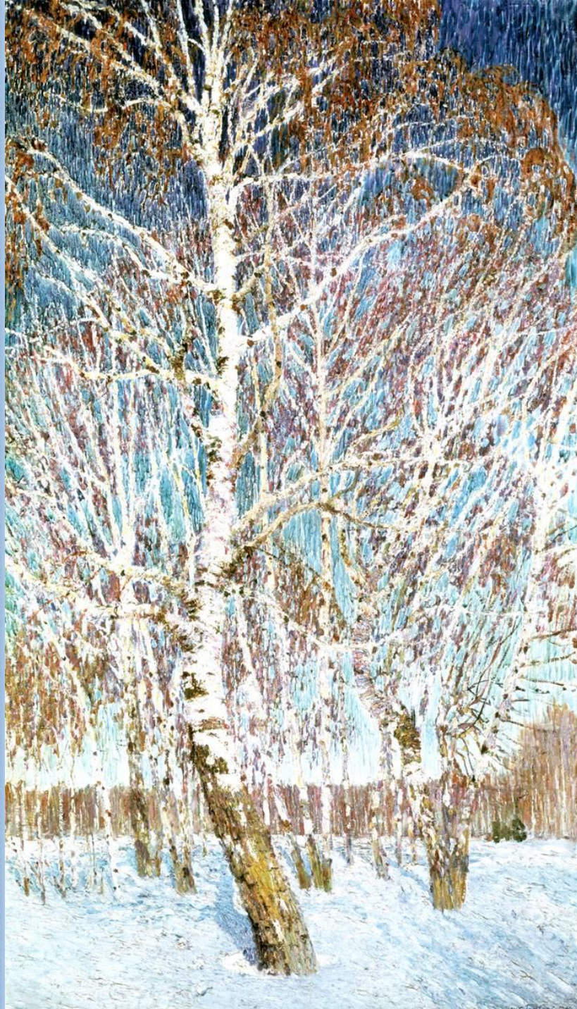
Грабарь И.Э. Февральская лазурь