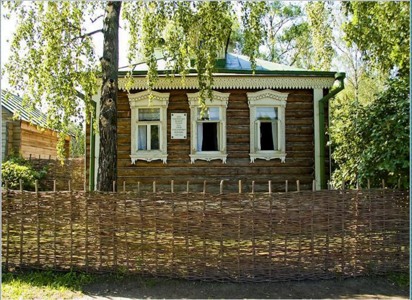
Село Константиново, где прошли годы детства, юности и ранней зрелости Есенина. 1965 г. дом родителей поэта стал мемориальным домом-музеем С.А. Есенина.