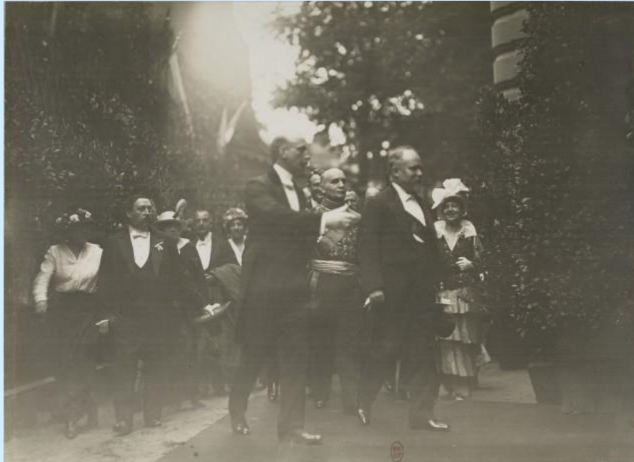
Официальный визит президента Франции Раймона Пуанкаре в 1914 году