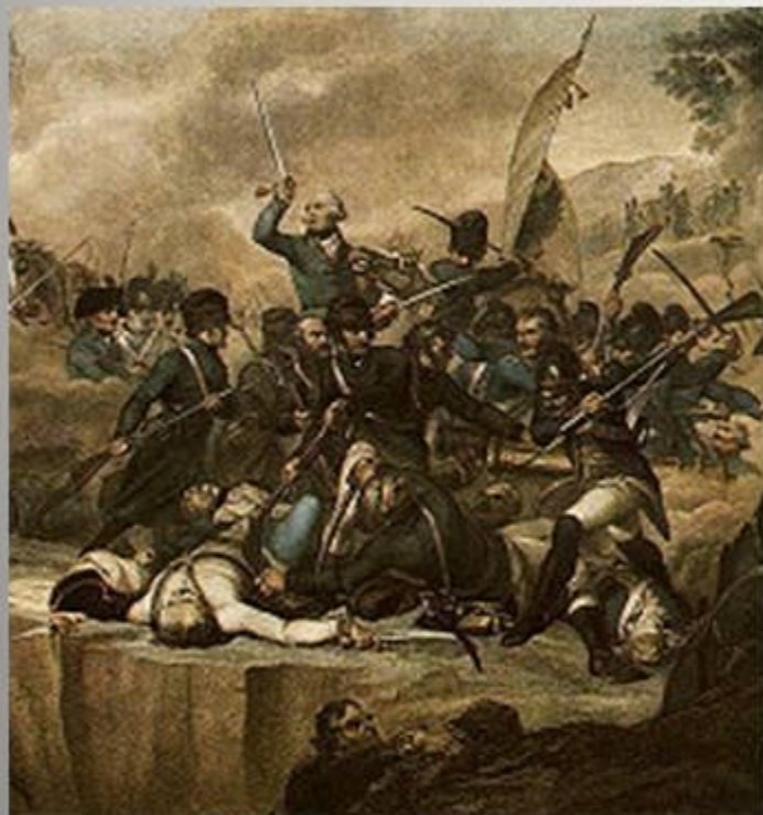
Сражение на реке Адда. Художник Спиаветти

Суворов оказал значительное влияние и на иностранную военную мысль. Русский военный историк Ф. Н. Глинка писал: «Теперь уже ясно и открыто, что многие правила военного искусства занял Наполеон у нашего Суворова. Этого не оспаривают сами французы; в этом сознаётся и сам Наполеон».