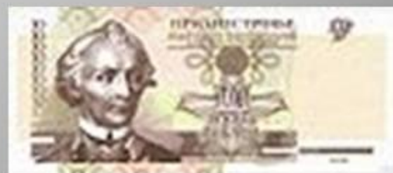
Бумажная купюра. Приднестровье.