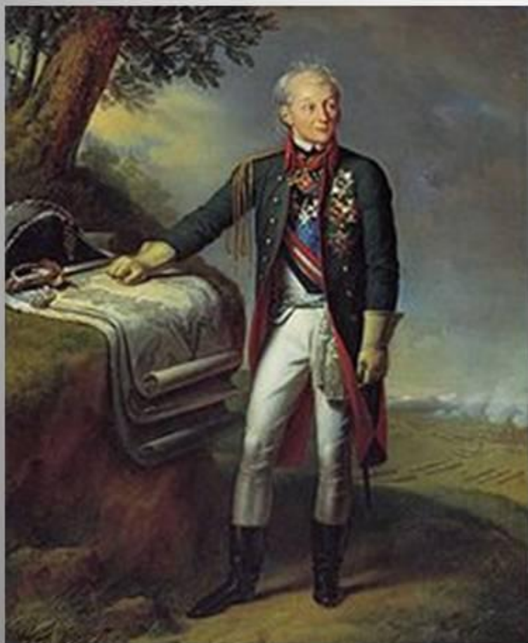
«Портрет А. В. Суворова». Художник К. Штейбен , 1815