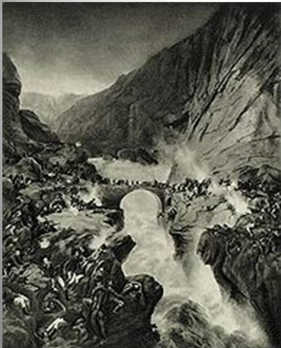
Переход Суворова через Чёртов мост. Художник А. Е. Коцебу

Движение русских войск началось из г. Таверно, затем последовал знаменитый переход через Альпы, когда суворовские войска вписали в русскую военную историю на вечные времена легендарное взятие Чертова моста, труднейший подъем через Росштокский хребет, а затем через горный хребет Паникс. Павел I очень верно оценил действия Суворова: «Побеждая всюду и во всю Вашу жизнь врагов Отечества, Вам не доставало одного — преодолеть и самую природу, но Вы и над нею одержали ныне верх» . Длинный перечень громких названий суворовских побед пополнился блестящими подвигами на швейцарских горных высотах.