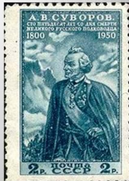
Почтовые марки о Суворове А.В.