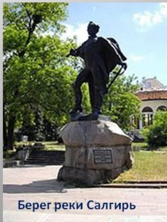
Берег реки Салгирь