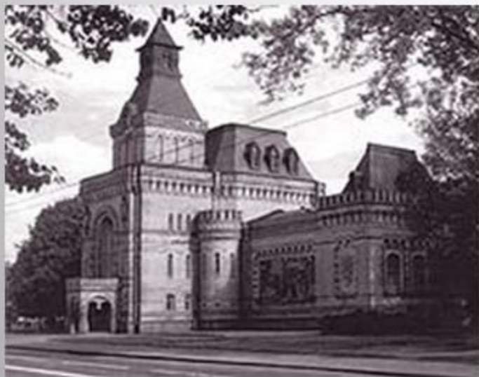
Мемориальный музей в Санкт-Петербурге