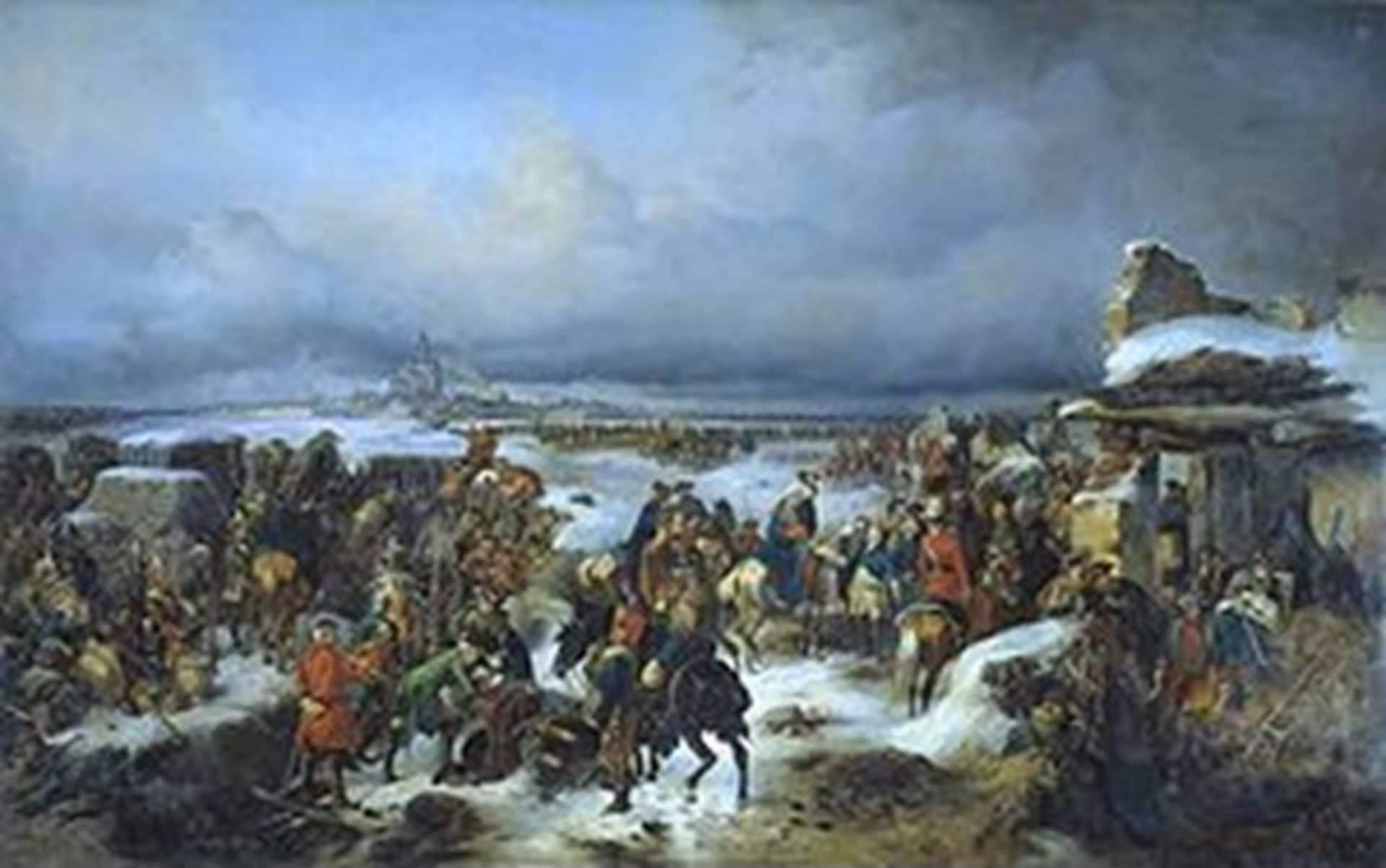
«Взятие крепости Кольберг в ходе Семилетней войны» . А. Коцебу. 1852 год. На картине изображено взятие крепости русскими войсками в 1761 году.