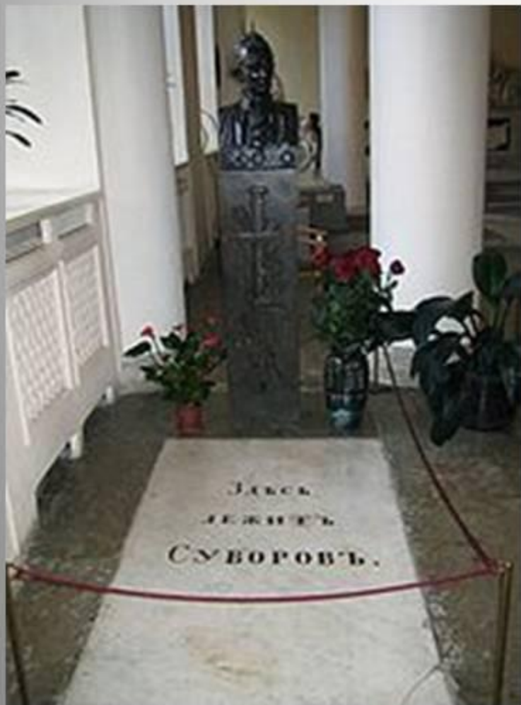
Александровская-Невская лавра. Санкт-Петербург.

Суворов умер по прибытии в Петербург 6 мая 1800 года и был похоронен в Александровской-Невской лавре. Более 50 лет своей жизни он посвятил военной деятельности, участвовал в семи войнах, не зная поражений, провел 60 сражений, с его именем связаны самые блестящие страницы русского оружия.