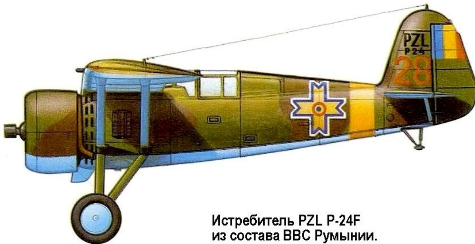
Истребитель PZL P-24F из состава ВВС Румынии.