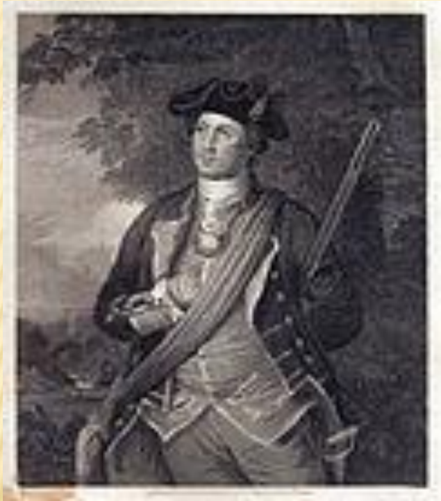
40 жастағы Уошингтон (1772)