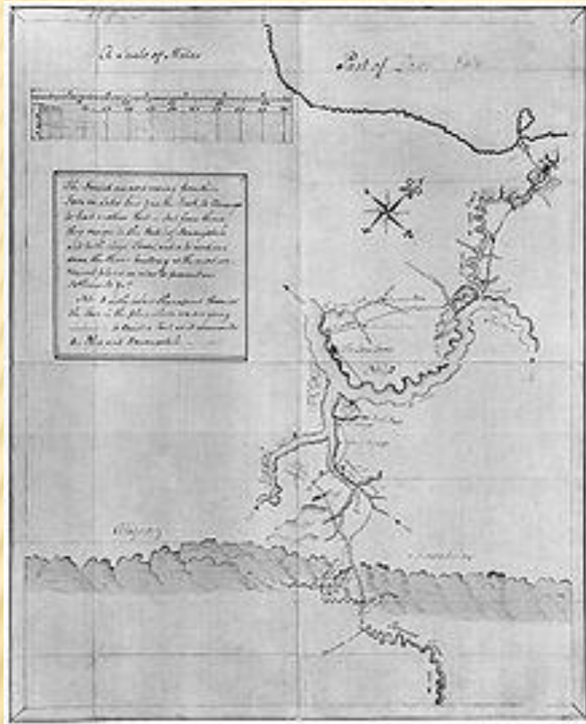
Уошингтонның Огайо журналындағы (Journal to the Ohio) картасы (1753–1754).