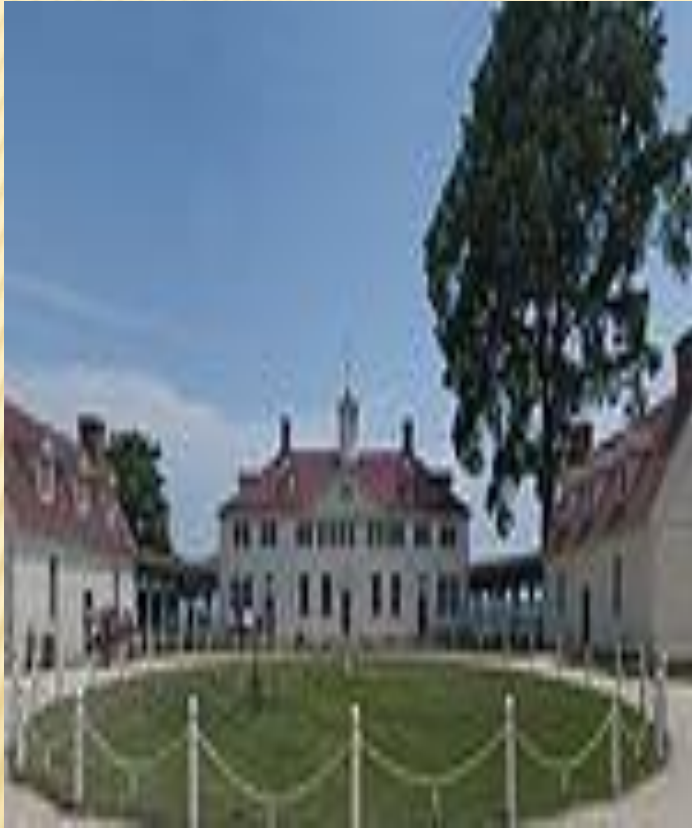
Уошингтонның үйленуінен кейінгі Маунт- Вернондағы үлкейткен үйі