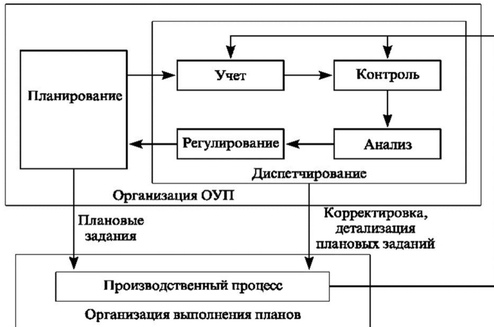
Рис. 28. Схема функциональной структуры системы ОУП