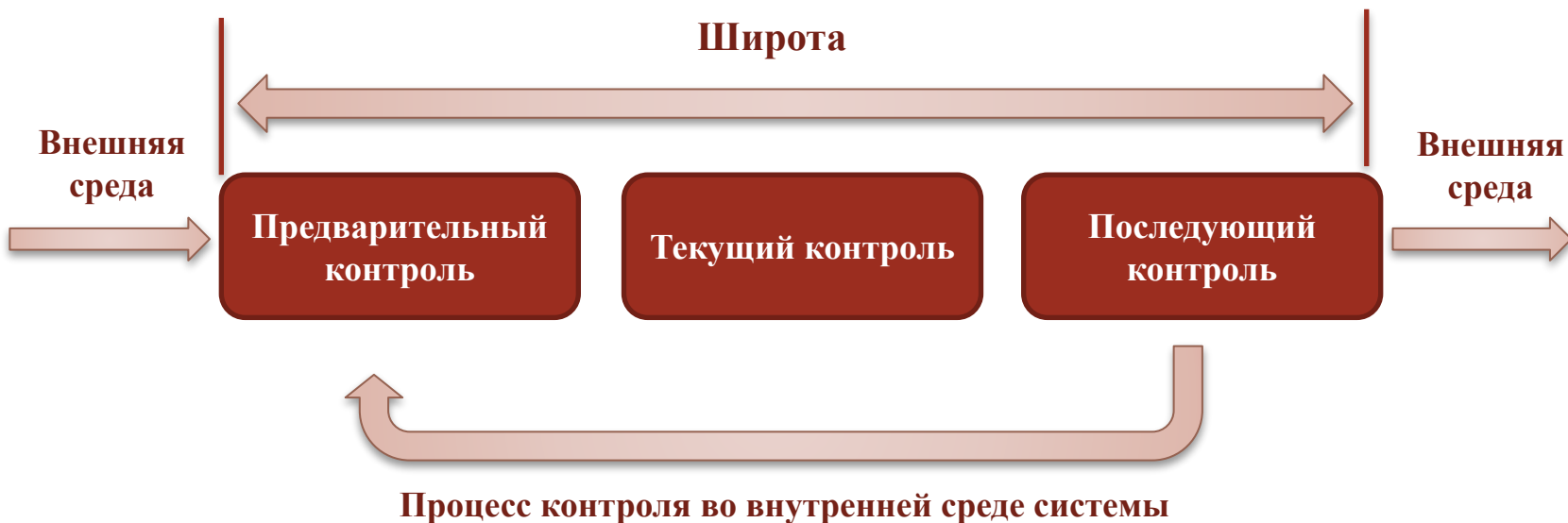
Схема процесса контроля:

Широта контроля – период времени, который проходит с момента предварительного, опережающего контроля (постановка цели, задачи, адресного ответственного, срока исполнения) до заключительной точки последующего контроля или контроля по результатам исполнения задач и достижения цели.