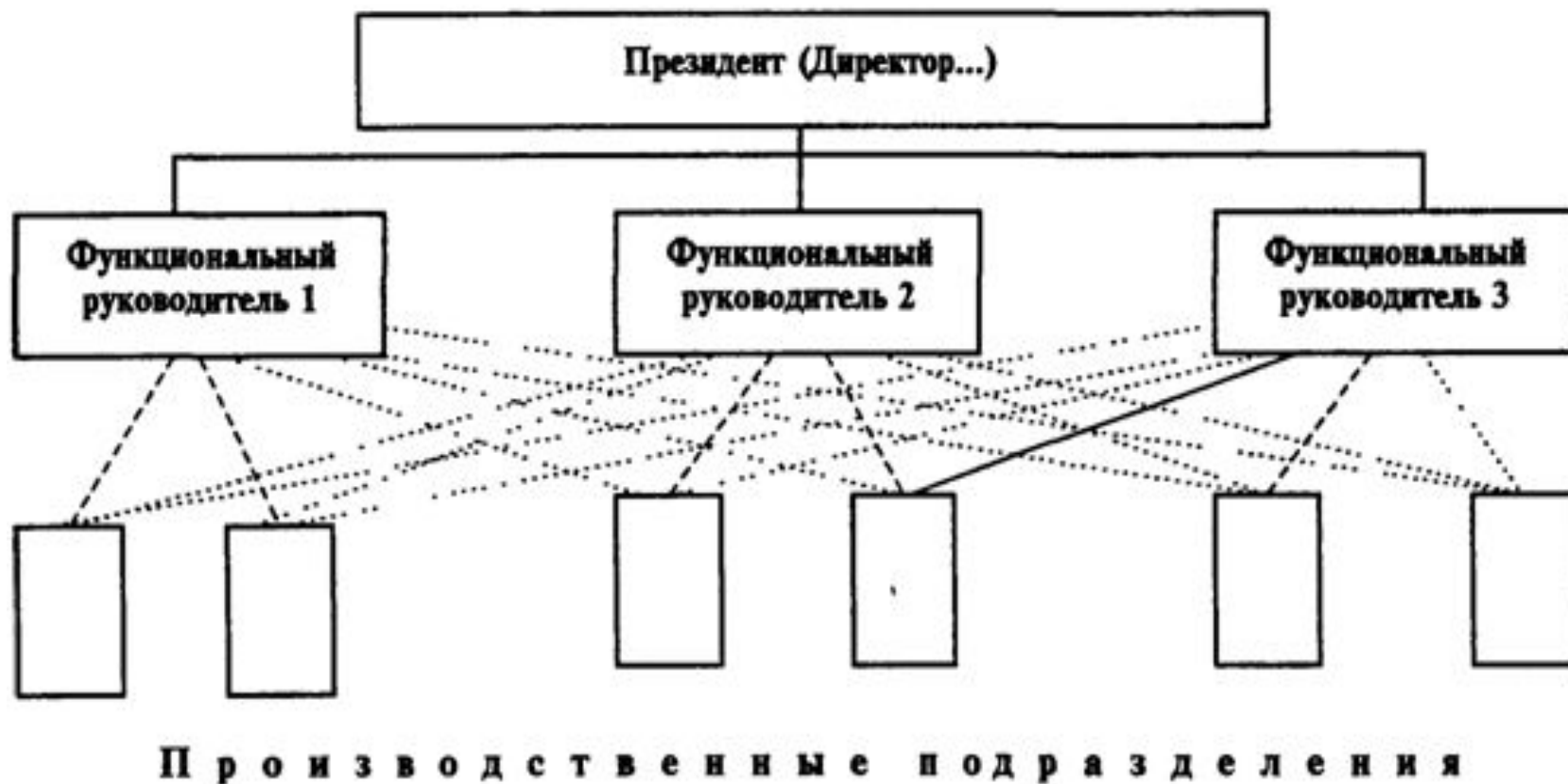
Рис. 2.2. Функциональная организационная структура