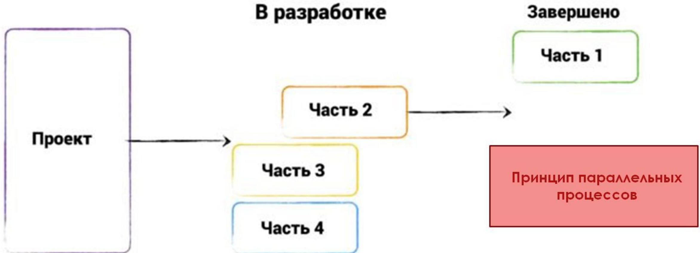
Рисунок 4: Схема работы по Agile