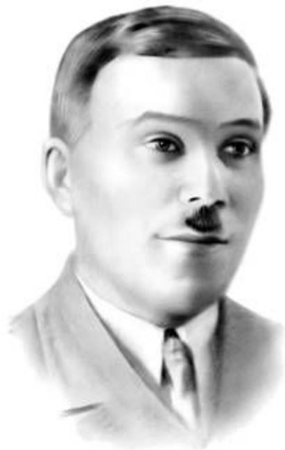
Микола Куліш (1892—1937)