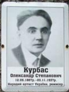
Курбас Олександр Степанович 12.09.1887р. – 03.11.1937р. Народний артист України, режисер.