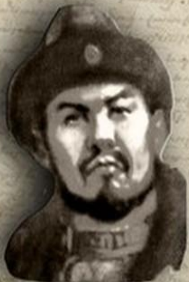
(1445–1518) «ҚАСҚА ЖОЛЫ» (СВЕТЛЫЙ ПУТЬ) ҚАСЫМ ХАН