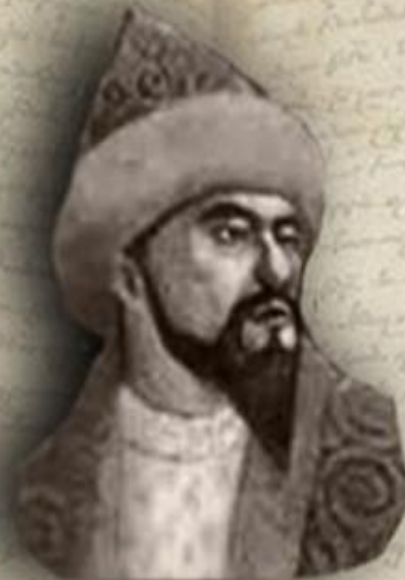
(1598 — 1628) «ЕСКІ ЖОЛЫ» (ДРЕВНИЙ ПУТЬ) ЕСІМ ХАН