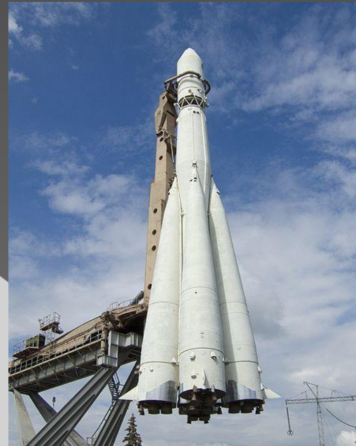
Макет ракеты-носителя “Восток” в Москве

Восток — наименование серии советских космических кораблей, предназначенных для полётов по околоземной орбите. Создавались под руководством генерального конструктора Сергея Павловича Королёва с 1958 по 1963 год.