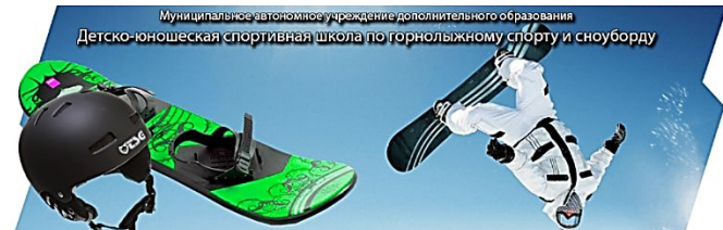
ДЮСШ по горнолыжному спорту и сноуборду (образование)