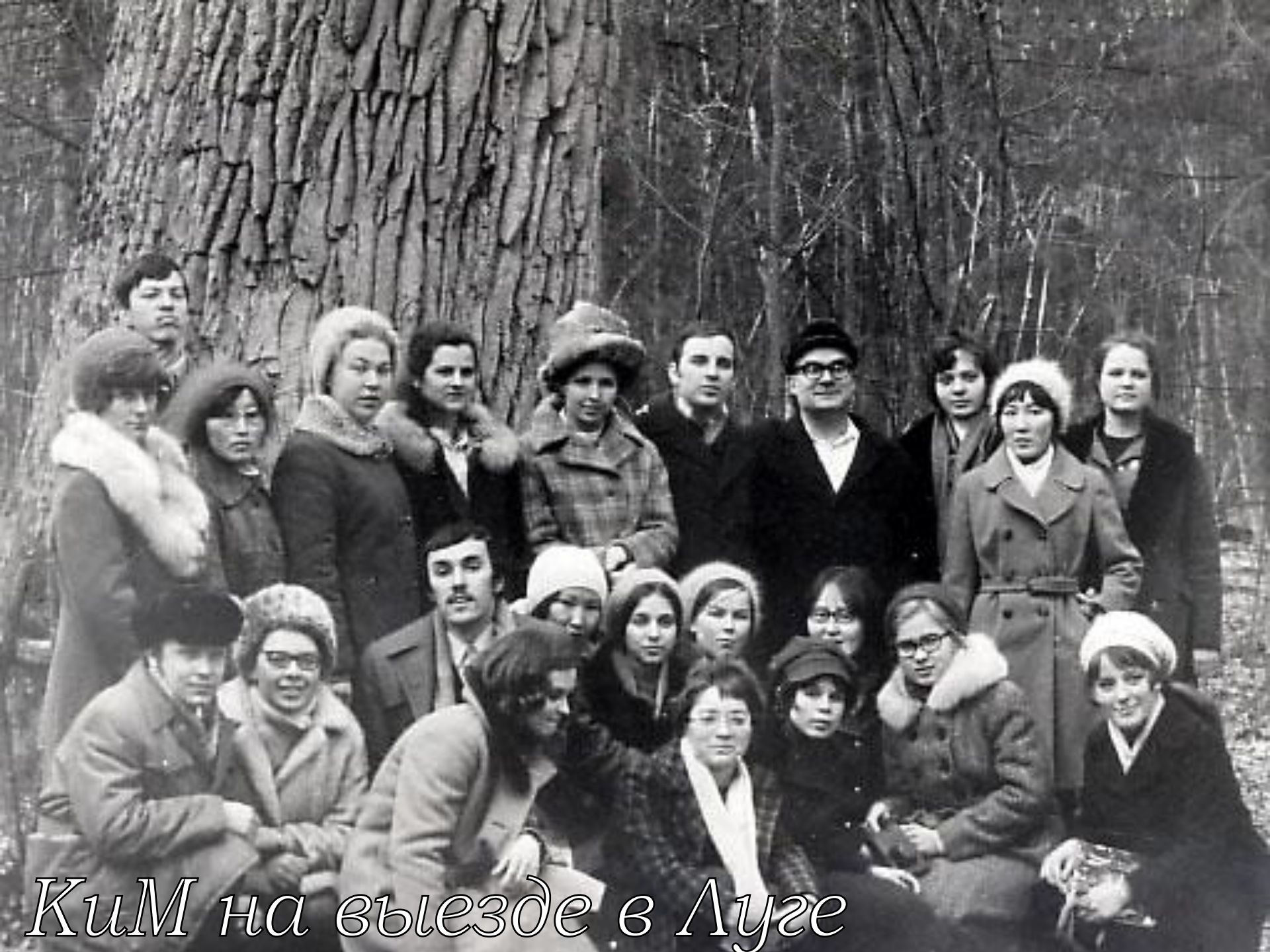
КиМ на выезде в Луге