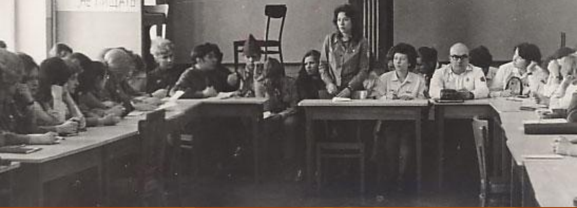
IX Слёт Коммунарского Макаренковского содруж