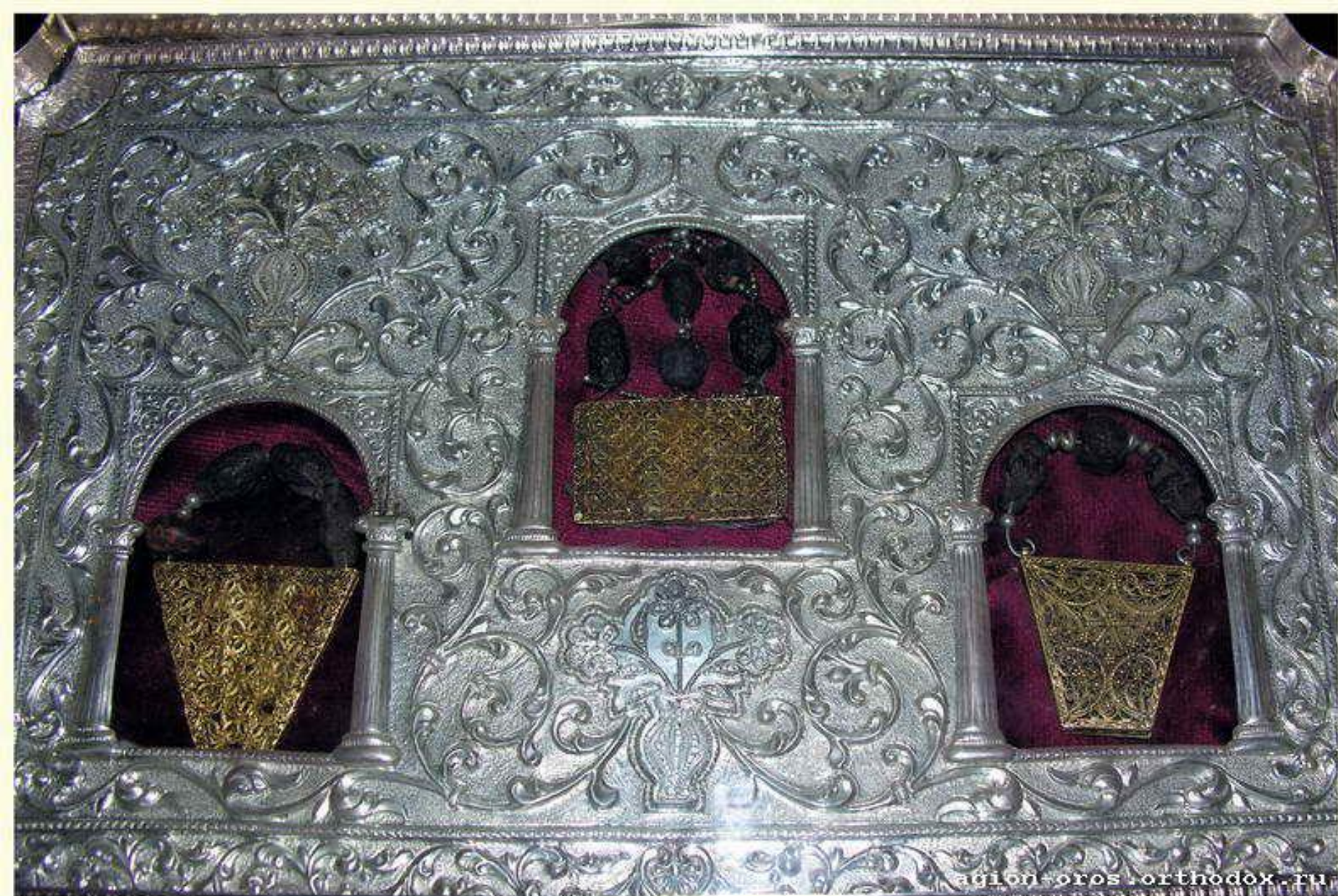
Дары Волков. Святая Гора Афон. Греция. Начало I века.