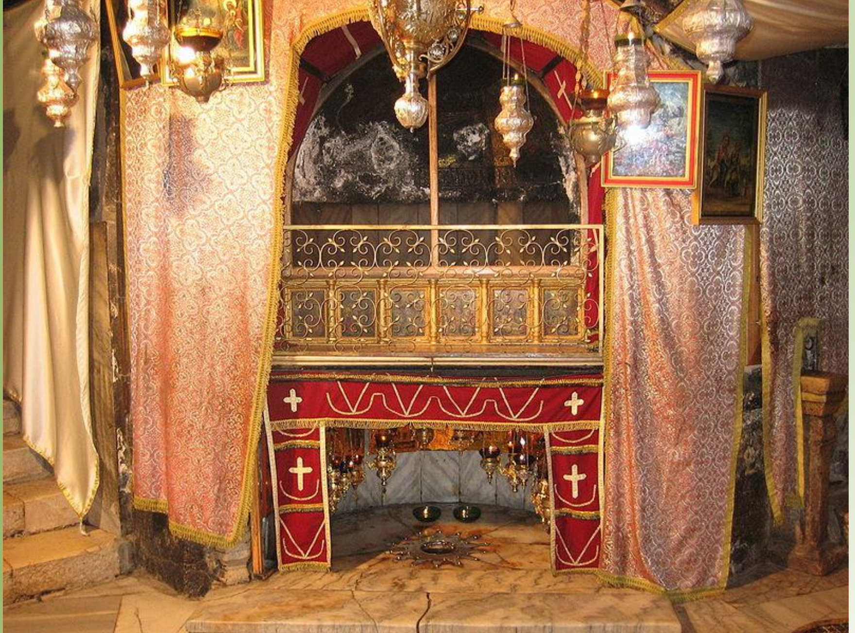
Святой престол над местом рождения Спасителя в Пещере Рождества Христова