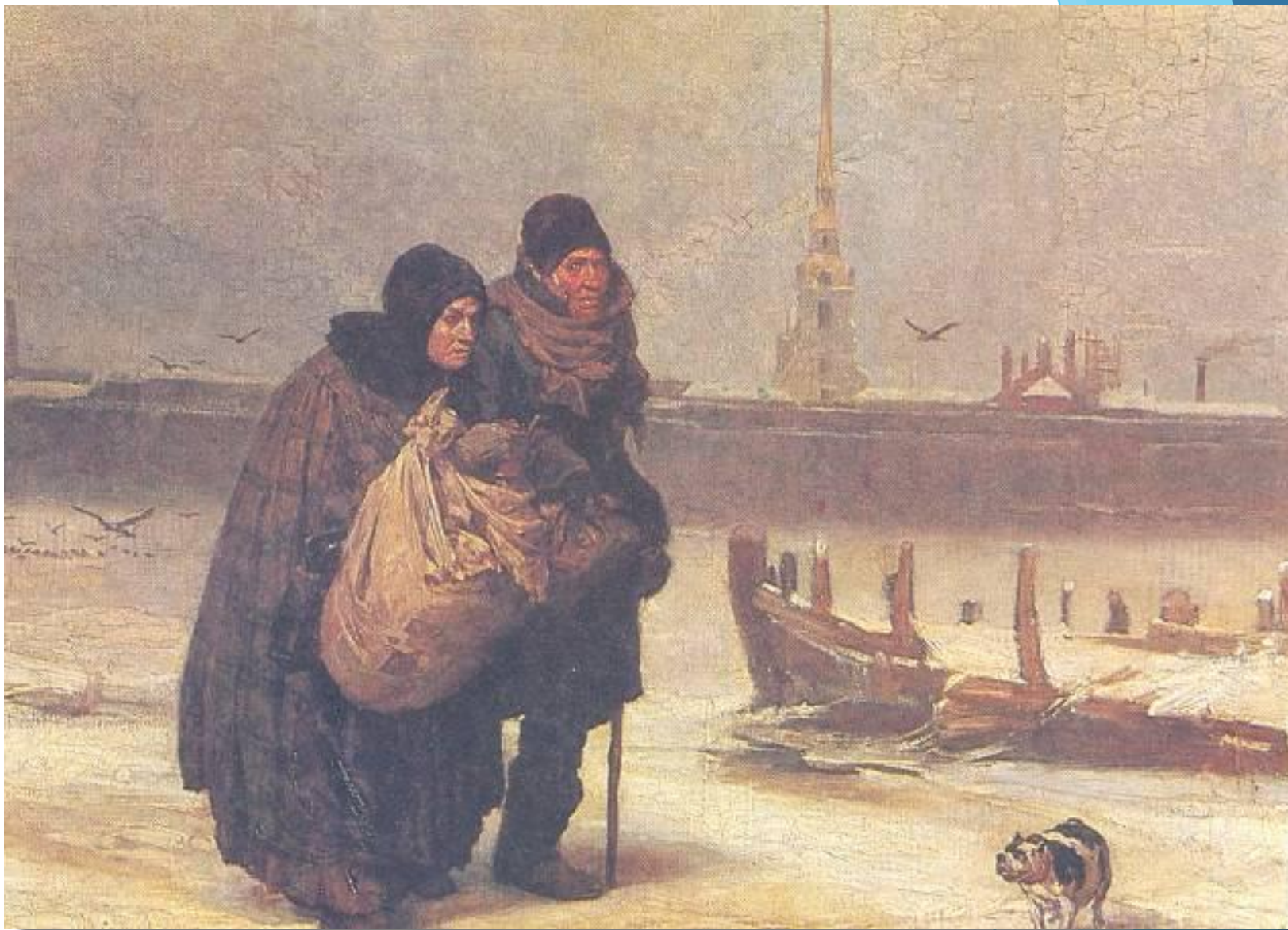
Виктор Васнецов. «С квартиры на квартиру»