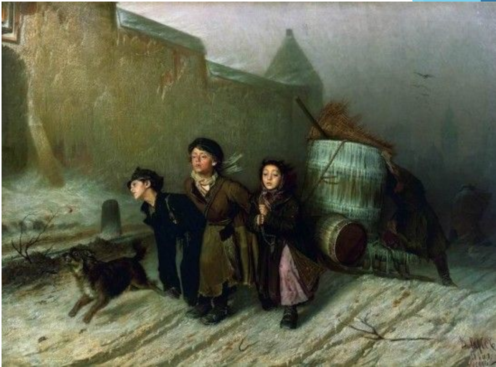
«Тройка». Василий Григорьевич Перов