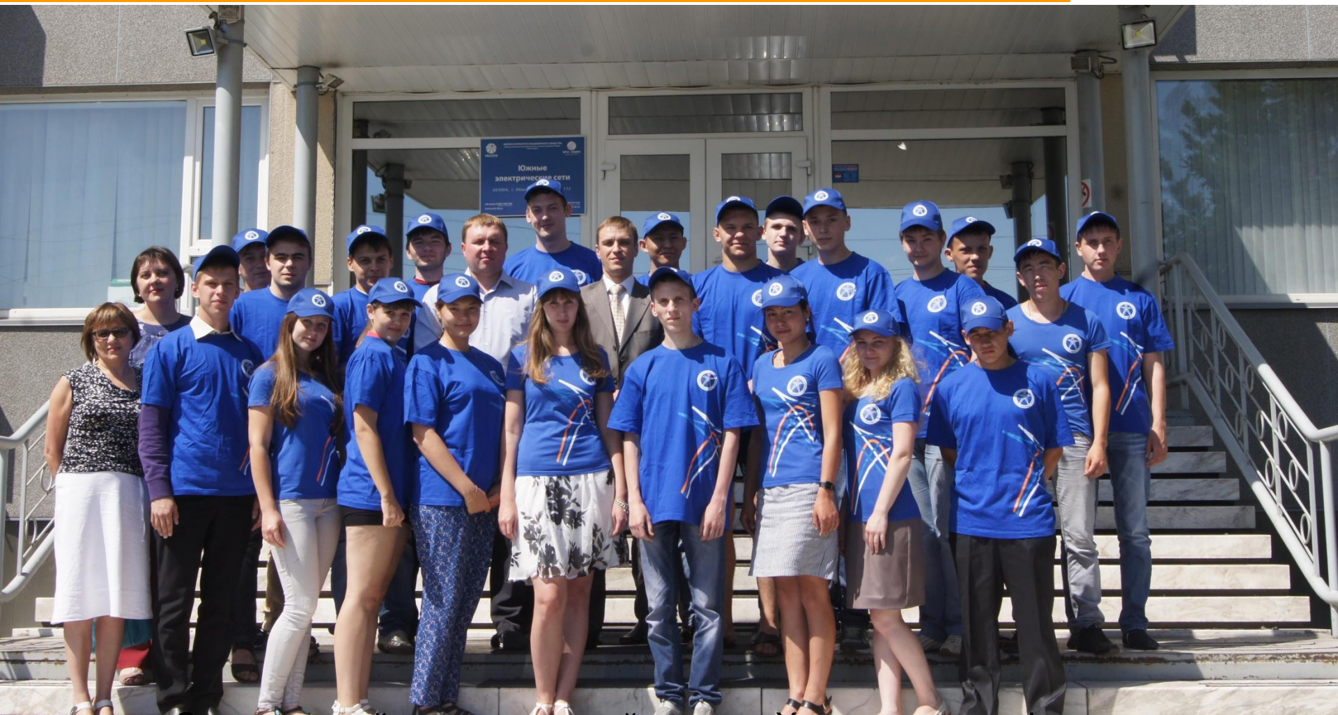
Студенческий энергетический отряд «Хакасэнерго» - филиала ПАО «Межрегиональная распределительная сетевая компания Сибири»