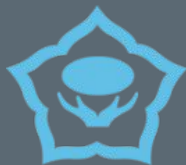
ВНИИ Картофельного Хозяйства