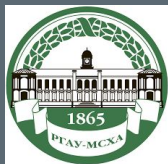
РАСУ-МСХА им. Тимирязева