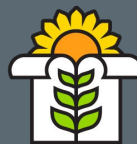
ВНИИ Масличных культур