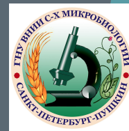
ВНИИ С/Х Микробиологии