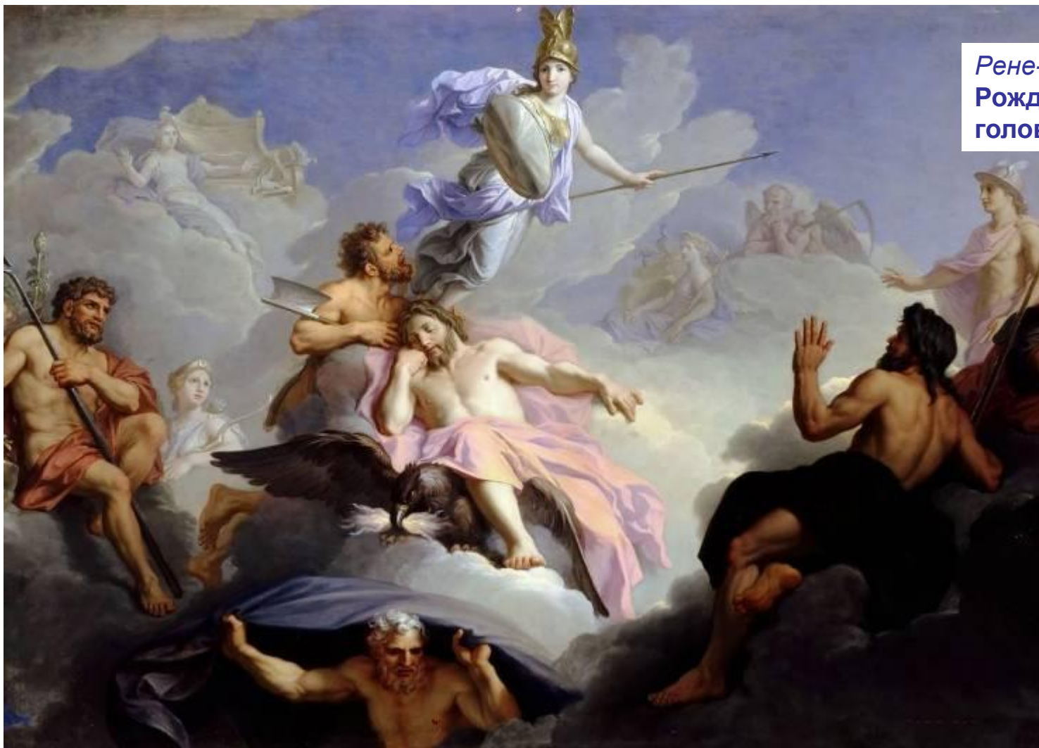
Рене-Антуан Уасс. Рождение Минервы из головы Юпитера

Однажды у Юпитера страшно разболелась голова, и, надеясь, что боги смогут подсказать, как избавиться от боли, он собрал их всех на Олимпе. Но совместные усилия облегчить страдания Юпитера ни к чему не привели, даже советы Аполлона, бога медицины, оказались бесполезными. Не желая терпеть дальше эту адскую боль, Юпитер попросил одного из своих сыновей, Вулкана , разрубить ему голову топором. Послушный бог с живостью повиновался, но не успел он ударить топором, как из головы Юпитера появилась Минерва (Паллада, Афина), облаченная в сверкающие доспехи, с острым копьем, распевая торжествующую песню победы.