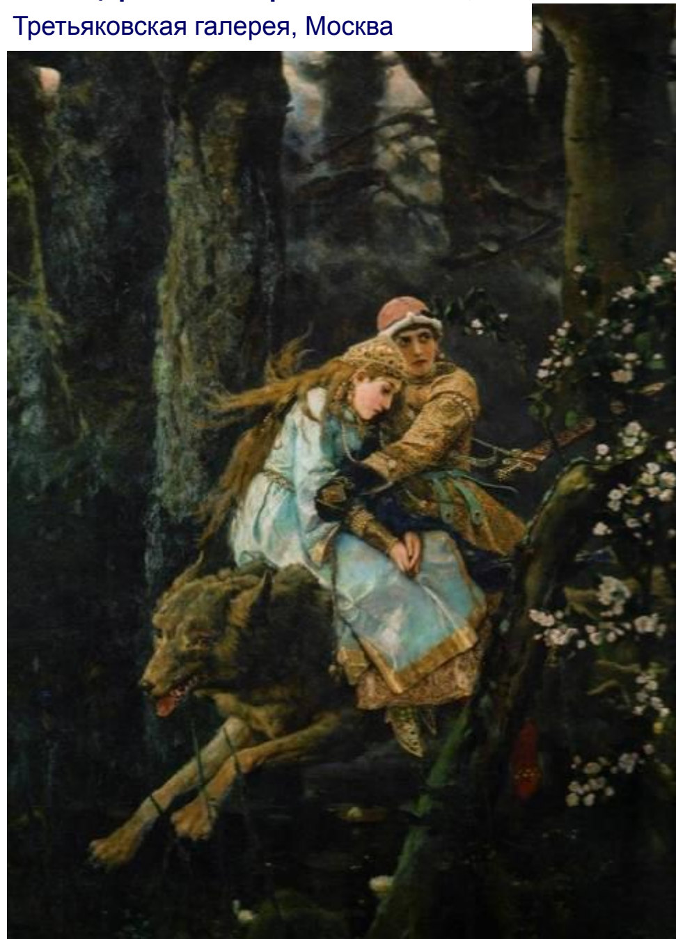
Иван Царевич на сером волке 1889, Третьяковская галерея, Москва