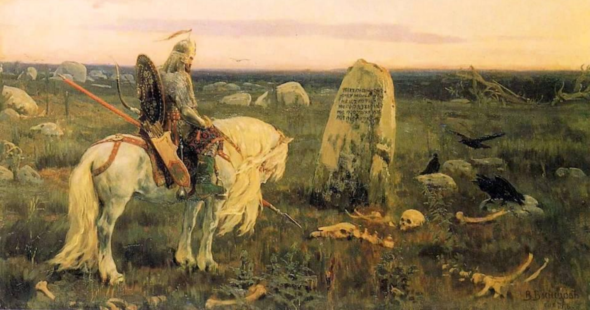
Витязь на распутье, 1878 Русский музей, Санкт-Петербург