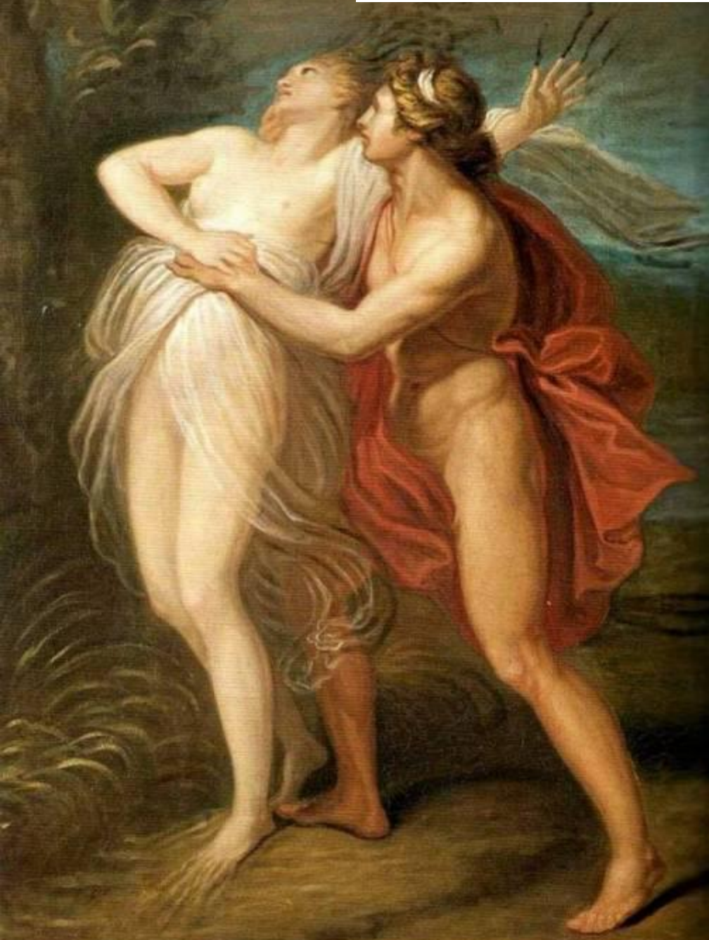
Аппиани Андреа. Аполлон и Дафна