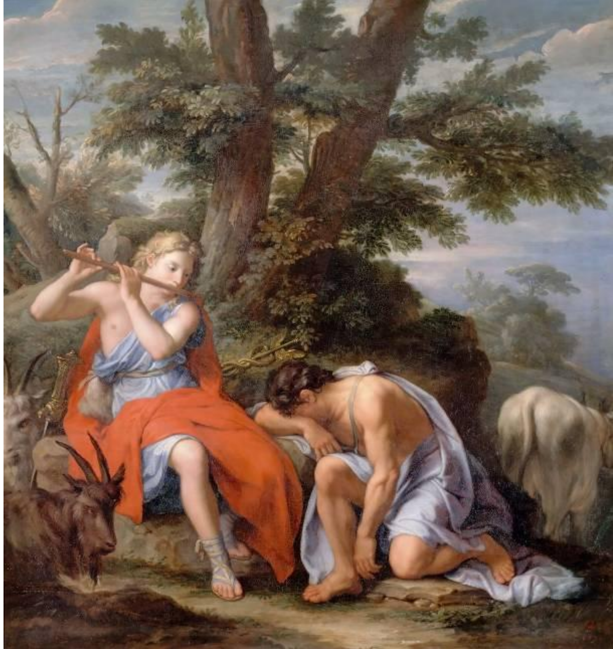
Рене-Антуан Уасс. Меркурий и Аргус

Юпитер был в отчаянии — вот уже долгое время он не мог ни поговорить со своей возлюбленной Ио (которую он превратил в корову, чтобы его жена Юнона ни о чем не догадалась), ни вернуть ей человеческий облик. Тогда он попросил своего помощника Меркурия спасти Ио. Захватив с собой несколько маковых головок, Меркурий подошел к Аргусу (который по приказу Юноны охранял Ио) и предложил рассказать ему сказки, чтобы скоротать время. Всем было известно, что Меркурий — прекрасный рассказчик, и Аргус с радостью согласился, но Меркурий стал рассказывать такие длинные и неинтересные сказки, что Аргус вскоре закрыл половину из своих тысячи глаз и крепко уснул. Продолжая говорить все тем же монотонным голосом, Меркурий осторожно вытряс мак на голову великана, и вскоре все его глаза закрылись — он погрузился в сон.