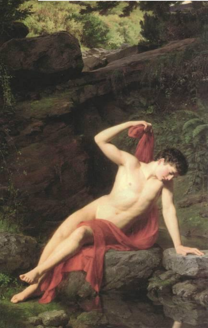
Odevaere Joseph Denis. Нарцисс, 1820