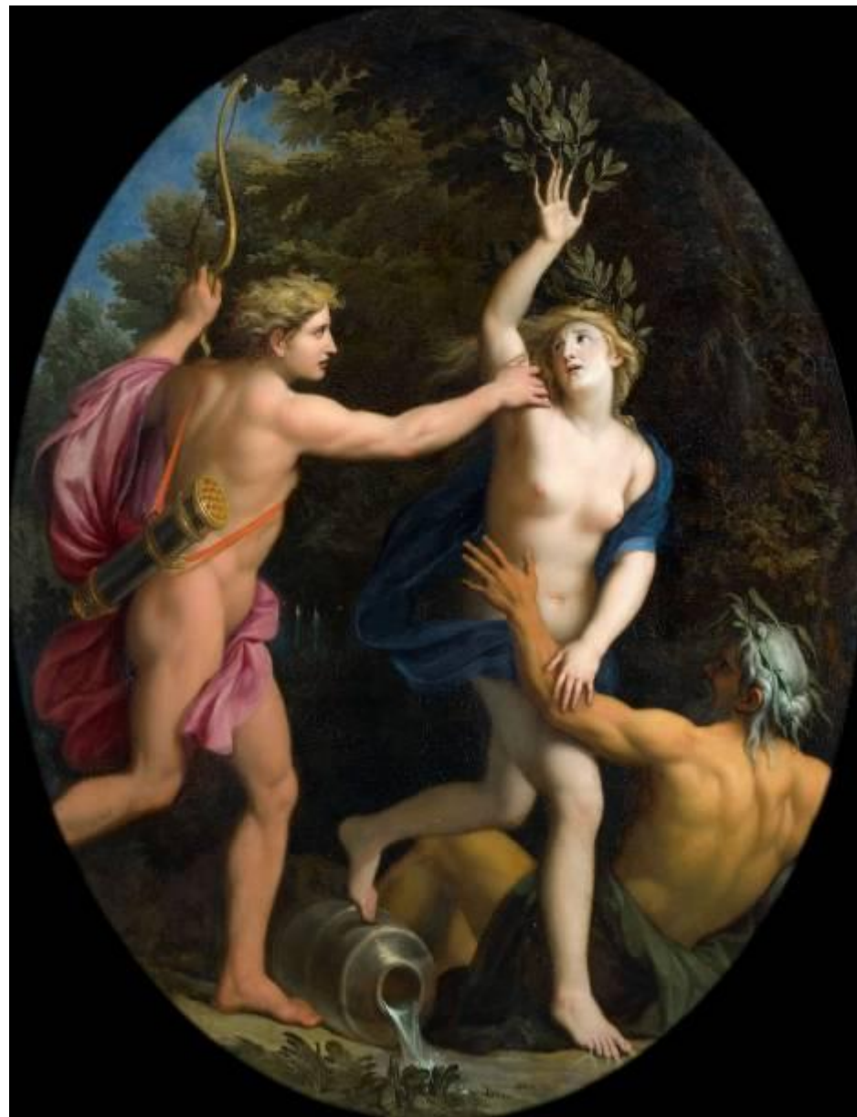
Аполлон и Дафна

Он осторожно приблизился к ней, стараясь не испугать, но не успел сказать и слова, как она бросилась бежать, а он, забыв обо всем, кинулся за ней вдогонку. Аполлон громко кричал, убеждая остановиться хоть на мгновение и обещая не делать ей ничего плохого. Но испуганная девушка не обращала внимания на его обещания и уговоры и бежала до тех пор, пока не почувствовала, что выбилась из сил, и не поняла, что, несмотря на все ее старания, преследователь ее догоняет. Дрожа от страха, она свернула с дороги и бросилась к реке, громко моля отца защитить ее. Не успела она добежать до берега, как ее ноги, казалось, приросли к земле, а дрожащие руки и тело покрылись толстой древесной корой и на пальцах выросли листья. Отец спас ее, превратив в лавровое дерево. Аполлон, подбежавший к ней с раскрытыми для объятия руками, ощутил под своими пальцами шершавый ствол дерева. Сначала до него не дошло, что прекрасная девушка потеряна для него навсегда, но когда он понял это, то заявил, что с этих пор лавр станет его любимым деревом, и поэты, музыканты и художники впредь будут награждаться лавровым венком.