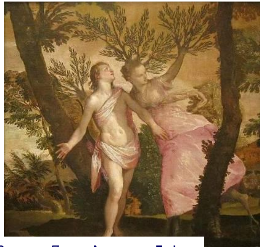
Веронезе Паоло. Аполлон и Дафна