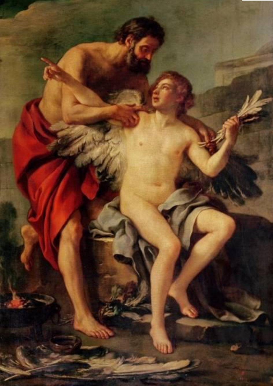
Жозеф-Мари Вьен. Дедал учит Икара летать.