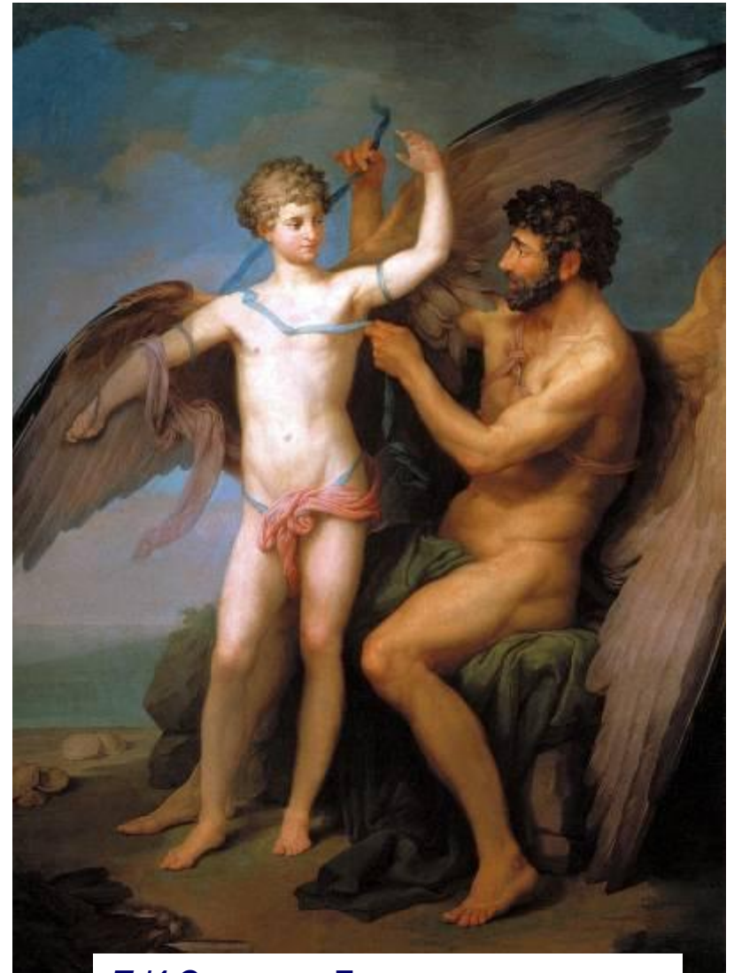
П.И.Соколов. Дедал привязывает крылья Икару