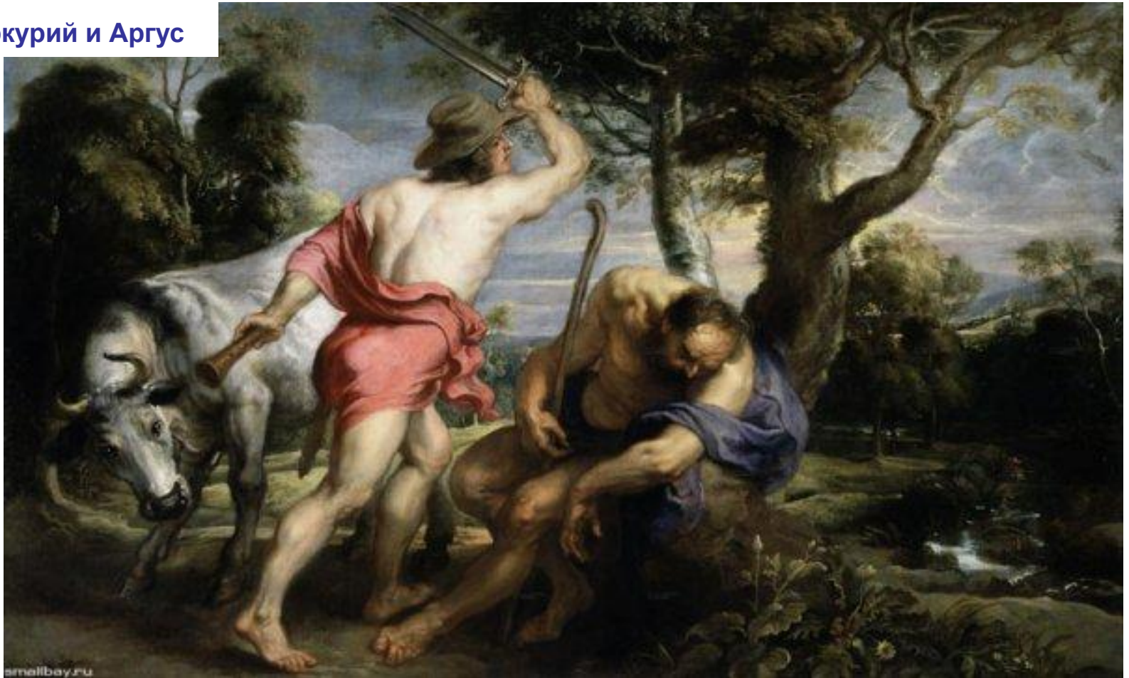
Рубенс. Меркурий и Аргус

Тогда Меркурий схватил меч и одним ударом отсек голову Аргуса от тела. Выполнив половину задания, Меркурий потащил корову прочь, но Юнона увидела это и тут же наслала на бедное животное огромного овода, который начал жалить ее. Доведенная до безумия его укусами, Ио бежала из одной страны в другую, перепрыгивая через реки, и, наконец, бросилась в море, которое с тех пор называется Ионическим. Переплыв его, она очутилась в Египте, где Юпитер возвратил ей человеческий облик, и где она родила сына Эпафа — первого царя Египта и основателя Мемфиса. Юнона горько оплакивала смерть своего верного Аргуса и, собрав его глаза, прикрепила их на хвосты своих любимых птиц, павлинов, которые должны были всегда напоминать ей о преданном слуге.