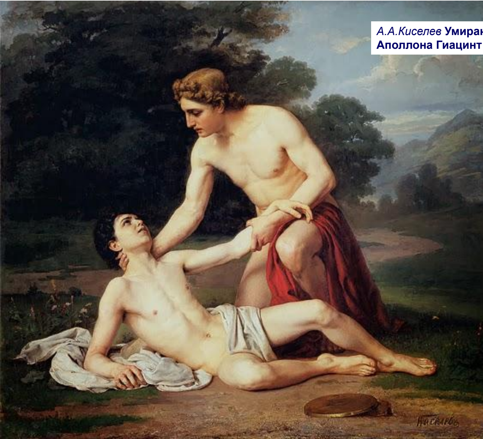
А.А.Киселев Умирающий на руках Аполлона Гиацинт 1884 г.