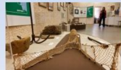
МБУ «Беломорский районный краеведческий музей «Беломорские петроглифы»