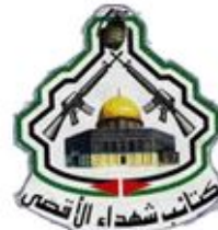
Al Qsa Martyrs Brigades